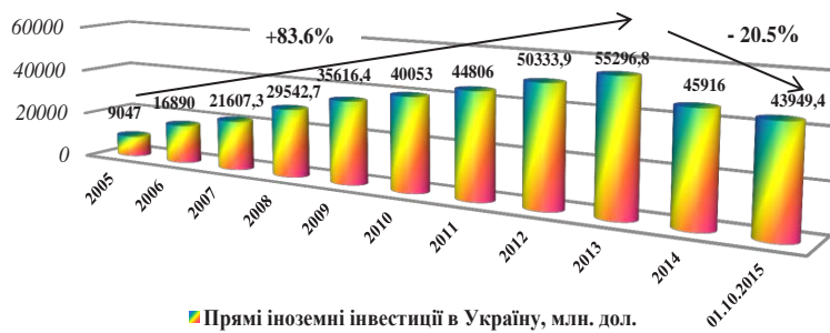
Рис. 1. Обсяг залучених прямих іноземних інвестицій в українську економіку на початок кожного року, млн. дол.