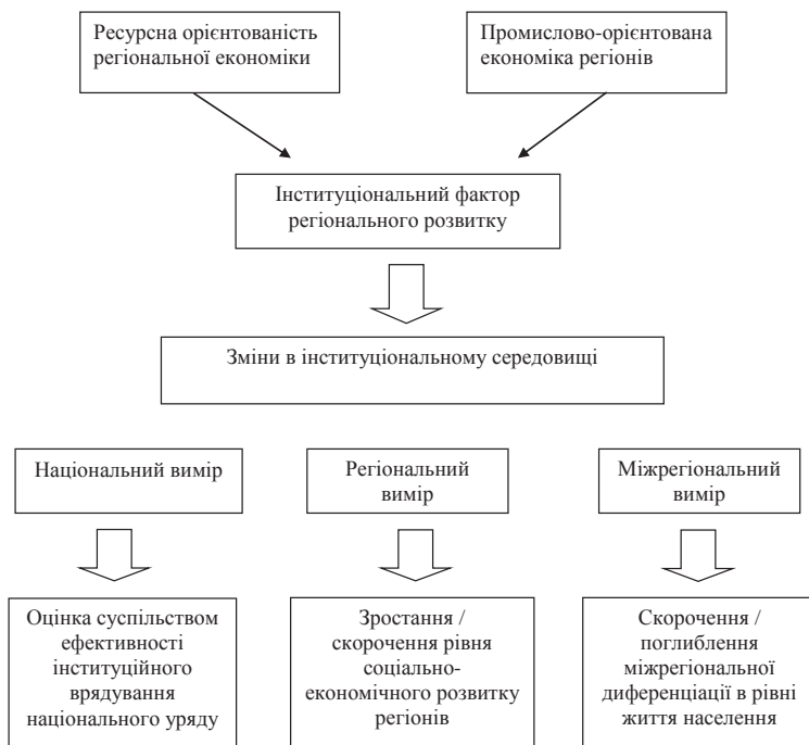
Рис. 3. Структурно-логічна форма інституціональної моделі міжрегіональної конвергенції соціально-економічного розвитку [складено автором]

Поділ моделі міжрегіональної конвергенції соціально-економічного розвитку на інституціонально-соціальну та інституціонально-структурну, здійснений в рамках даного дослідження, покликаний оцінити вплив соціального та структурного аспектів інституціональних змін на соціально-економічний розвиток регіонів і рівень його диференціації. Разом з тим, соціальна та структурна складові інституціонального середовища не виключають важливість і практичну значимість інших інституціональних факторів. Останні можуть відігравати важливу роль в міжрегіональних відносинах, дослідження їх ролі вимагає комплексного аналізу в рамках окремої теоретико-емпіричної роботи.