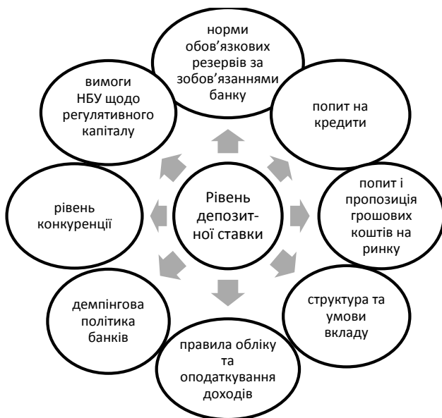
Рис. 3. Фактори, що впливають на рівень депозитної ставки

Залежно від виду депозитного рахунку, строку розміщення коштів на депозиті та суми вкладу банки встановлюють диференційовані ставки. Ціноутворення за депозитними зобов'язаннями банку ґрунтується на аналізі співвідношення між депозитною ставкою і витратами банку на обслуговування кожного виду депозитних рахунків. Якщо операційні витрати банку за рахунком значні (наприклад, розрахунковим рахунком клієнта), то ставка буде низькою або взагалі відсотки не виплачуватимуться. Іноді витрати з обслуговування депозиту банк перекладає на клієнта, стягуючи фіксовану комісійну винагороду за проведення кожної операції, а відсотки виплачує за залишком коштів на клієнтському рахунку. Рівень депозитної ставки залежить від багатьох факторів, які наведені на рис. 3.