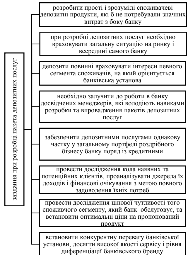
Рис. 4. Завдання при розробці депозитних послуг

Головним завданням банку при розробці пакета депозитних послуг (наведено на рис. 4) має стати чітке формулювання того, чому клієнти повинні принести свої заощадження у конкретний банк.