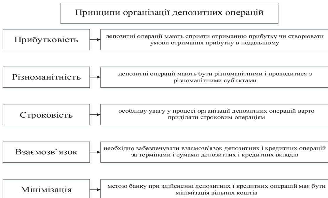
Рис. 1. Принципи організації депозитних операцій [8]

Процес управління депозитними операціями передбачає наявність комплексу стратегічних і тактичних заходів, які здійснюють комерційні