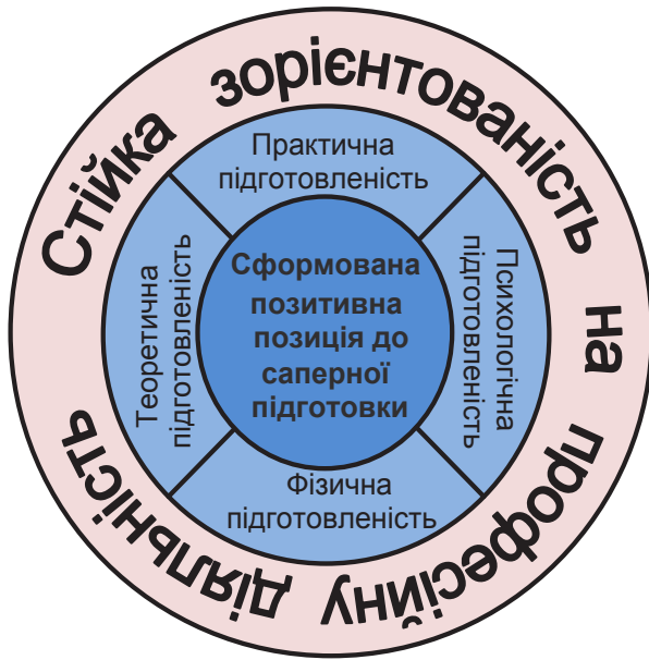
Рис. 2. Модель виконавця, як наслідок впливу на нього процесу навчання саперної справи