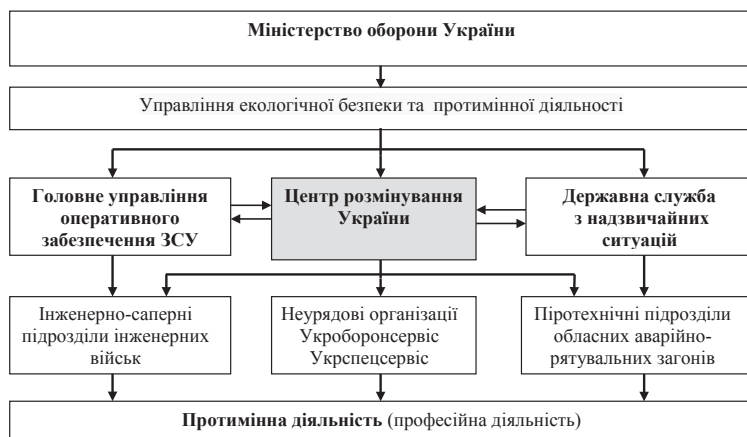
Рис. 1. Структура протимінної діяльності в Україні

У цих умовах підготовку фахівців із розмінування до прийняття самостійних рішень та при виконанні завдань необхідно організувати як цілеспрямований, послідовний і багатоетапний процес нарощування творчого потенціалу фахівця, під час якого відбувається формування та розвиток його професійної компетент-