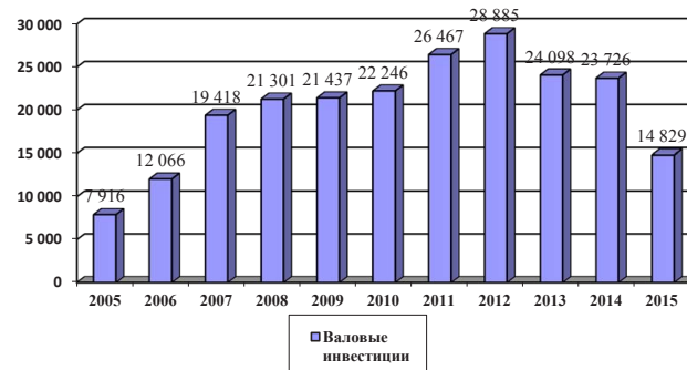
Рис. 2. Динамика валового иностранного притока инвестиций

ционная прибыль, полученная от иностранных инвесторов предприятиями в разрезе отраслей; 22% – акционерный капитал; 14,4% – межбанковские краткосрочные кредитные соглашения и займы; 2,3% – инвестиции в бюджет.