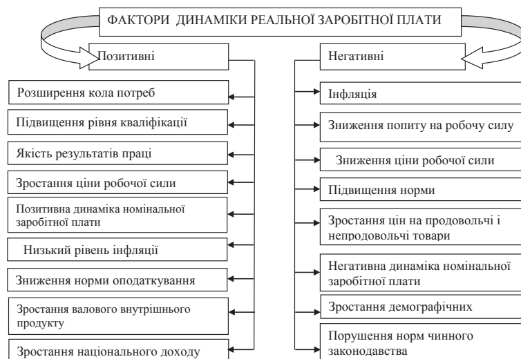
Рис. 3. Чинники, що впливають на рівень реальної заробітної плати