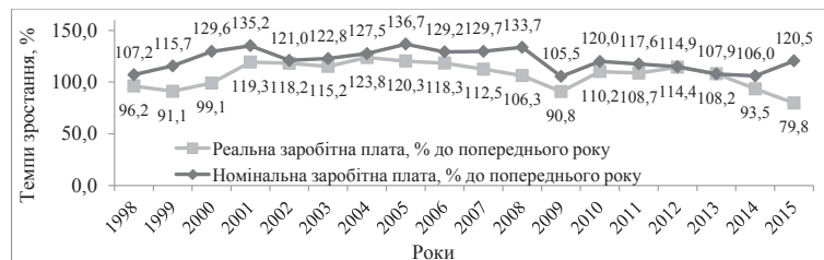
Рис. 2. Динаміка номінальної та реальної заробітної плати в Україні