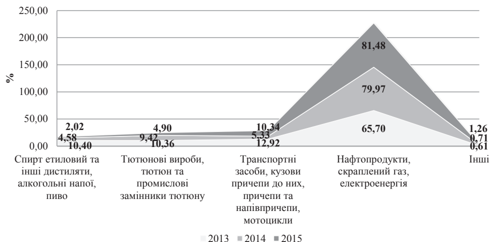
Рис. 2. Структура надходжень акцизного податку із ввезених на митну територію України підакцизних товарів за 2013-2015 роки Джерело: розроблено авторами за даними [2, 3, 4]

Крім того, за даними Звіту про виконання Плану роботи Головного управління Державної фіскальної служби у Львівській області за 2015 рік, впродовж 2015 року видано 55,7 млн. шт. марок акцизного податку для маркування алкогольних напоїв вітчизняного виробництва та 88,7 млн. шт. для маркування тютюнових виробів вітчизняного виробництва. За результатами проведення оперативних заходів вилучено з незаконного обігу підакцизних товарів на суму 21,8 млн. грн., а саме: тютюнові вироби – 406,7 тис. пачок на загальну суму 7,87 млн. грн.; готова лікєро-горілч-