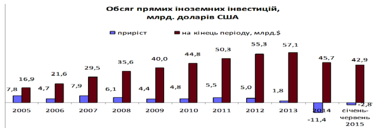
Рис. 3. Динаміка обсягу прямих іноземних інвестицій в економіку України, 2005-2015 рр. [6]

Такі зміни не приносять позитивних результатів, а навпаки стимулюють розвиток тіньового сектору економіки, який має негативну тенденцію до зростання, оскільки за останній рік темпи росту тіньової економіки піднялися до 40% [3]. З метою виходу з такої ситуації Україні варто започаткувати досвід західноєвропейських країн та країн-азійських тигрів (Японія, Сінгапур, Гонконг), де була значно звужена сфера бюджетного перерозподілу грошових потоків.