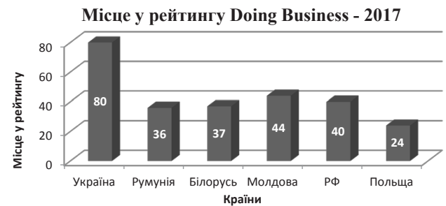
Рис. 2. Місце України у рейтингу легкості ведення бізнесу (Doing Business – 2017) серед країн світу

Результати проведеного аналізу дають підстави для твердження, що серед основних країн-сусідів України займає найгіршу позицію: 80 місце у 2016 р. (рис. 2), піднявшись на 16 позицій порівняно з 2015 р. [5]. Виникає дискусія відносно достовірності проведених розрахунків у питанні того, чи це було лише механічним покращенням рейтингу, чи дійсно відбулися суттєві зміни в умовах ведення бізнесу, що потребує додаткових досліджень та доведень.