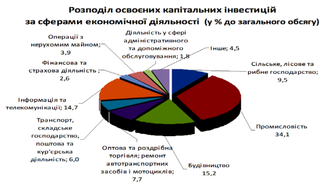
Рис. 4. Розподіл капітальних інвестицій за сферами економічної діяльності України у 2015 р. [6]

Не менш вагомою умовою політики дерегуляції є мінімізація безконтрольного проведення перевірок-рейдів з боку чиновників, що є прямим порушенням нововведених законодавчих норм [10]. Реформування системи державного контролю відбувається вкрай складно, адже ця система є однією з найбільш корумпованих, розгалужених та багатовекторних [11]. Необхідно зазначити, що політика дерегуляції може мати негативні наслідки як для соціальних верств населення так і для самих виробників, оскільки неконтрольоване підвищення цін може сильно позначитись на купівельній спроможності громадян [12].