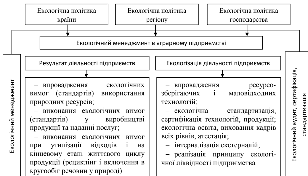
Рис. 1. Місце екологічного маркетингу в системі еколого-економічного управління підприємством [3, с. 42]

Відсутність ефективної системи управління в сфері охорони навколишнього природного середовища та занадто повільне, ніж очікувалося,