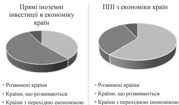
Рис. 1. Структура світових ПІІ

інвестиційних ресурсів та перспективи подальшого їх використання є надзвичайно важливим аспектом для формування, в подальшому, стратегії інвестиційно-інноваційного розвитку в світі входу до ЄС як економіки країни загалом так і пріоритетних її галузей.