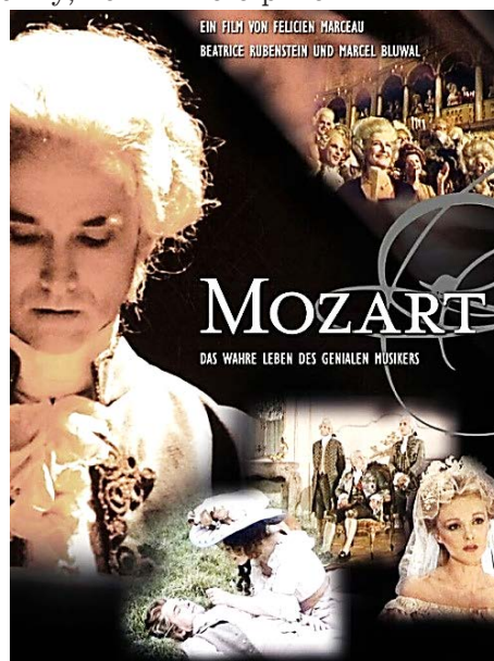
Рис. 1. Постер до фільму «Моцарт»

Даним прийомом автори користуються не тільки заради декорацій, але й з метою розкриття образу композитора, спроб розуміння його внутрішнього світу, певних його рішень.