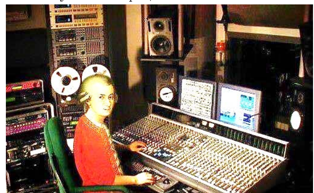
Рис. 4. «Моцарт за створенням чергового шедевру». Невідомий карикатурист

Висновки. Постаць великого австрійського композитора В. А. Моцарта увійшла в масову культуру XX-XXI століть як символ великої талановитості, таємничості, року, і іноді здається, що публіку більше зачаровує саме його особисте життя, ніж його музика. Але на нашу думку, сучасність куди більш складніша, і відповідь на це питання лежить в самому дусі часу і в тому, що відділення творчості від особистості творця їй вже абсолютно не притаманно. Великий інтерес сучасності до таємниці життя й смерті композитора не в якому разі не відмінє його сприйняття в якості втіленої геніальності, про що свідчить досить специфічна, але й не менш влучна ілюстрація: