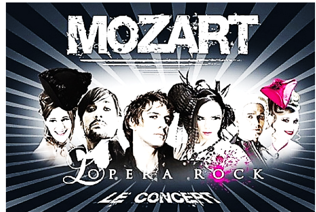
Рис. 3. Постер до рок-опери «Моцарт»

вав сам В. А. Моцарт, і до якого у першу чергу звернулася його дружина Констанція. Ейблер з великою цікавістю взявся дописувати твір, але після нетривалої роботи відмовився. Після нього над завершенням «Реквієму» працював учень В. А. Моцарта Ф. К. Зюсмайер, але точна кількість його доробків залишається предметом гарячих дискусій досі. У XXI столітті композитори також звертаються до цієї теми і намагаються закінчити геніальний твір. У 2011 британський композитор М. Фінісі дописав його фінал, що також стало предметом гарячих дискусій [8].