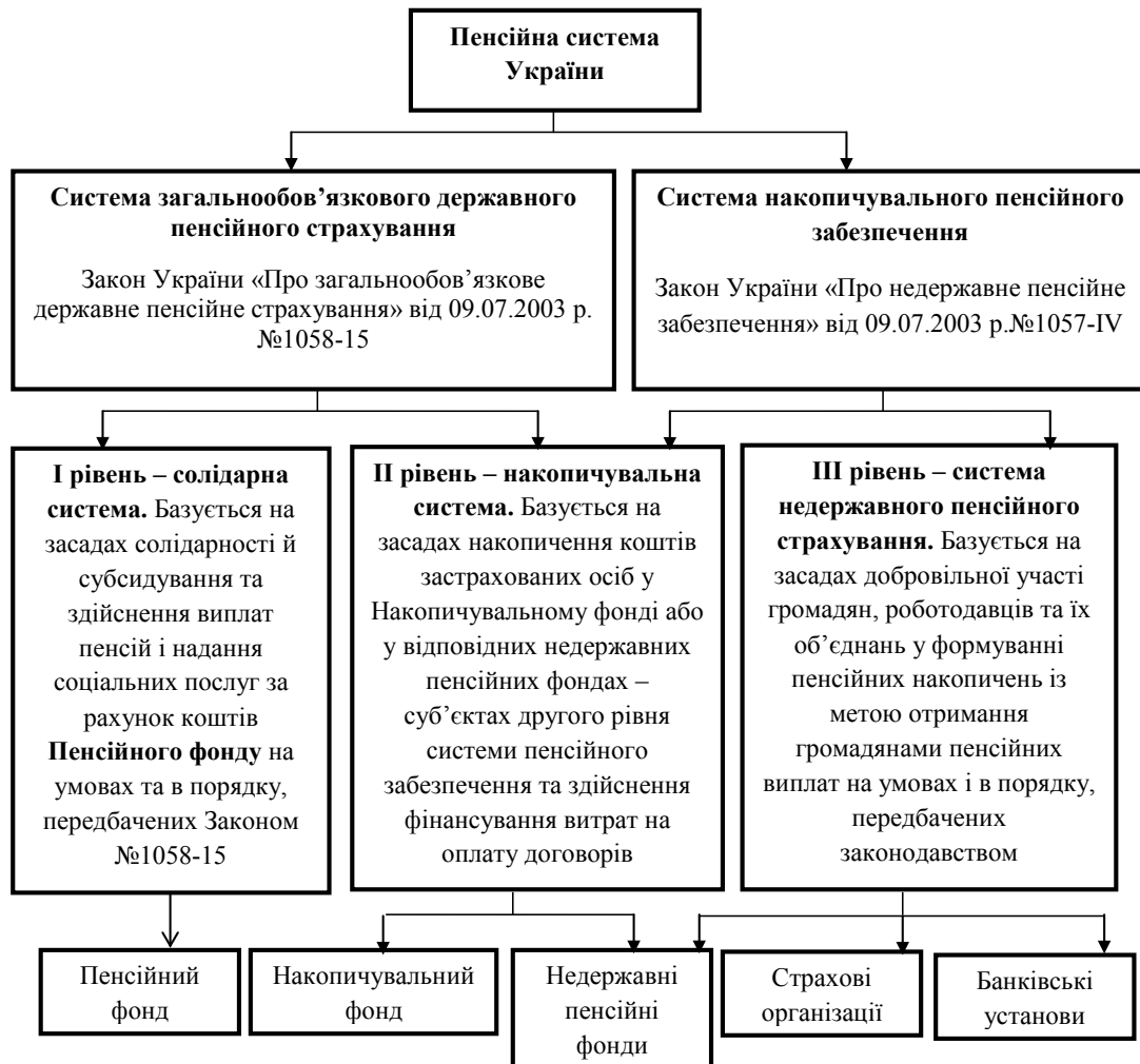
Рис. 1. Система пенсійного забезпечення України

Пенсійне забезпечення – це базова й одна з найважливіших соціальних гарантій стабільного розвитку суспільства, оскільки воно безпосередньо стосується всіх його верств. Аналіз існуючих