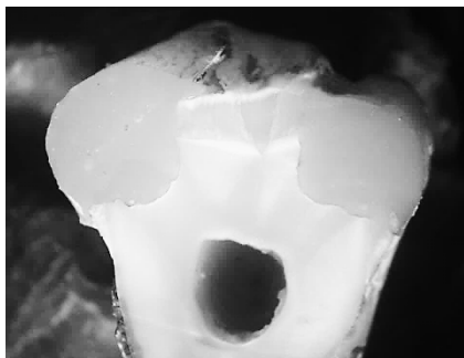
Рис. 2. Порушення крайового прилягання склоіономерного цементу

Окрім фізичного навантаження на зуб та порушення крайового прилягання пломби до стінок зуба, передумовою виникнення підвищеної чутливості зуба при використанні композитів, є кислотне травлення, котре впливає на змазаний шар дентину. Змазаний шар забезпечує проникність дентину і за даними Pashley D.H. [5] дозволяє швидше йому відновитися.