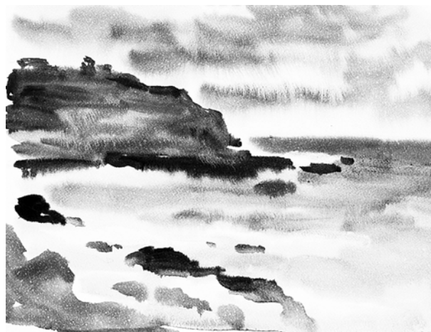
Рис. 12. О. Карпенко. «Шторм». 2011 г., бумага, акварель