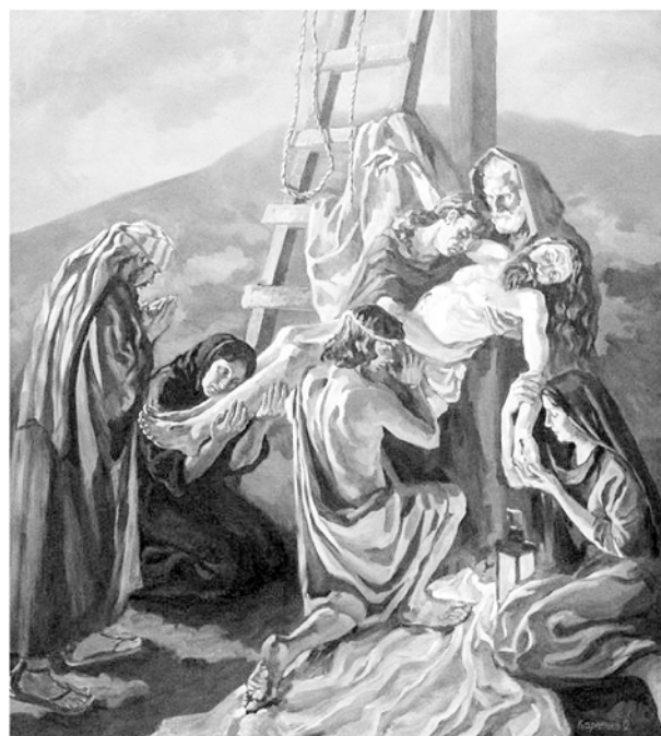
Рис. 11. О. Карпенко. «Снятие с креста». 2005 г., холст, масло

го незнания пластической анатомии и неумении рисовать человеческую фигуру. Мифологические и религиозные работы конца 1990-х – начала 2000-х гг. довольно глобальны по замыслу, сложны по композиции и весьма разнообразны по палитре – здесь Ольга перестает быть узнаваема по колориту и манере живописи и каждый раз избирает новый подход. В нескольких работах она отдает предпочтение латуровской контрастности, обращаясь к тенеброзо и ее холст буквально светится. Принцип латуровской свечи можно увидеть в «Легенде об огне» (2002 г., масло), еще более явно он использован в масштабном (более 2 м по большей стороне) «Снятии с креста», где вся композиция строится на отблесках огня светильника, стоящего у распятия (2005 г., масло, рис. 11). Есть и композиции, в которых Ольга снова становится свободно-импрессионистически настроенной, используя широкий мазок и не привязываясь к доминирующей роли линии, нивелируя роль контура, что в ее живописи встречается не так часто («Снятие с креста», 2003 г., масло).