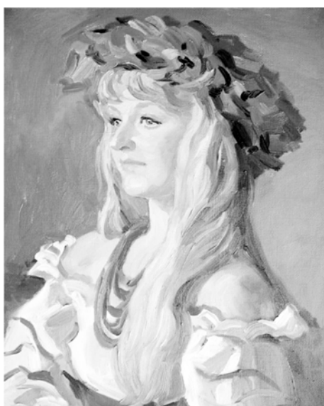
Рис. 10. «Роменская красавица». 2010 г., холст, масло

Все модели художника очень выразительны, «пойман» характер образа, особенно яркими выглядят образы пожилых людей – в них цепкий глазом автора легче передает все специфические черты индивидуальности модели.