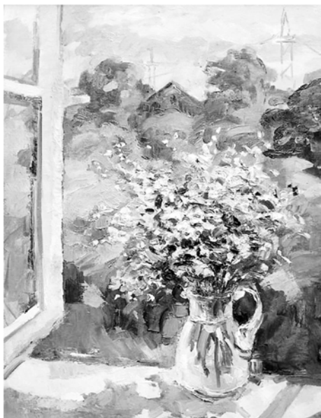
Рис. 7. О. Карпенко. «Полевые цветы». 1999 г., холст, масло