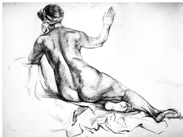
Рис. 2. О. Карпенко. «Обнаженная со спины», 1998 г., картон, уголь