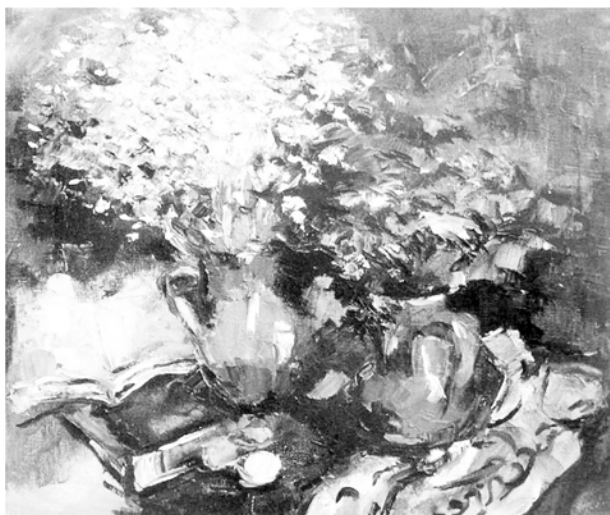
Рис. 8. О. Карпенко. «Натюрморт с васильками». 1998 г., холст, масло

Коллажность, декоративность решений многих работ Карпенко, ее пристрастие к пастозности, локальности цвета хорошо вписываются в представление о том, как нужно передавать мертвую природу. В творческом багаже Ольги Карпенко и немало натюрмортов, и именно в них, пожалуй, легче всего проступает ее декоративная манера.