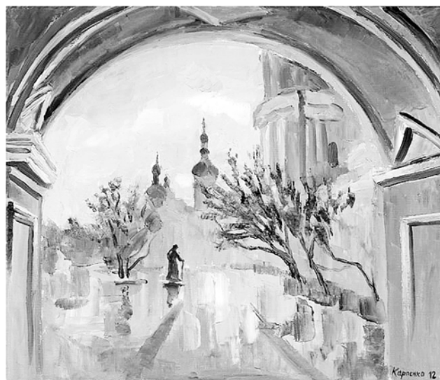
Рис. 3. О. Карпенко. «Успенский на рассвете», 2012 г., холст, масло

Из всего корпуса работ художника легче всего составить представление о характере живописи по пейзажному и портретному жанрам в