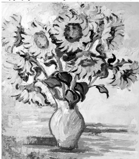
Рис. 6. О. Карпенко. «Подсолнухи». 2015 г., холст, масло

с запахом Сера («Бухта в Симеизе», 2002 г., масло, рис. 4; «Гурзуф. Айдалары», 2005 г., масло).