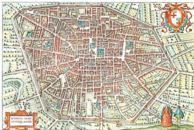
Рис. 2. Болонья. План міста XVI ст. (Braun and Hogenberg)

Багато міст Європи, які розвинулися на основі давньоримського табору змінювали шахматну планувальну структуру. Коли забудова міста виходила за межі первісної колонії, то поселення отримувало променеву радіальну систему. Вулиці направляли перехожого до колишніх воріт табору. [5, с. 95] Яскравим прикладом може слугувати Болонья (Рис. 2), Флоренція, Відень та інш.