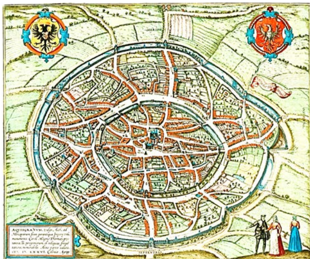
Рис. 1. Аахен на плані 1572-1574 рр.

Іноді місто розвивалося на основі групи селищ згрупованих навколо спільного ставка для громадського стада. В цьому випадку місто отримувало центричний характер плану (Сабоньєр, Зеленц, Рундлінг). В випадку формування міста вздовж дороги, з'являвся інший тип планування – лінійний (Единбург). Або, в разі розширення частини вулиці утворювалася ринкова площа. [13, с. 16] Найбільше розповсюдження отримали радіальні планувальні структури. Виникнув навколо замку, або монастиря, місто поступово оточувало його кільцем кварталів [5, с. 95]