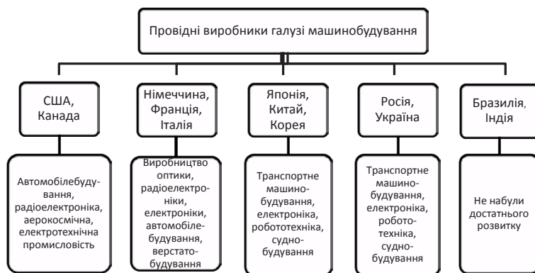
Рис. 2. Провідні виробники галузі машинобудування