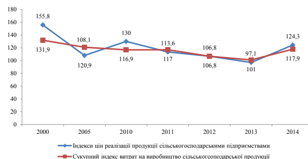
Рис. 2. Динаміка індексу цін реалізації продукції сільськогосподарськими підприємствами та сукупного індексу витрат на виробництво

ської продукції. Саме по собі їх підвищення є позитивним фактором і забезпечує відновлення паритету цін на продукцію села та цін у промисловості й інших галузях економіки.