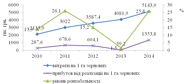
Рис. 3. Динаміка показників ефективності виробництва зернових і зернобобових культур сільськогосподарськими підприємствами України

Розглядаючи зміну витрат на 1 га, виходячи з даних Державної служби статистики України, слід відзначити, що по зерновим і зернобобовим культур цей показник за період 2010-2014 рр. у сільськогосподарських підприємствах України зріс у 2,4 рази, прибуток від реалізації в розрахунку на 1 га – у 4,7 рази, а рівень рентабельності майже вдвічі. Однак, два останні показники відзначаються суттєвими щорічними коливаннями, що підтверджує загальновідомий постулат щодо ризиковості аграрного виробництва.