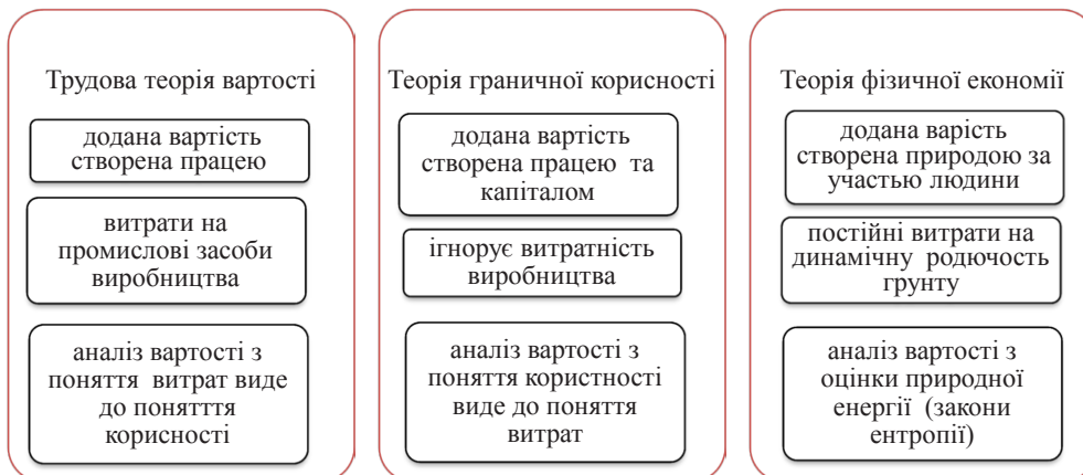
Рис. 3. Підходи до визначення витрат в теоріях (теоретичних концепціях)

Відповідно, родючість – живий і самодостатній процес, а мінеральні добра за теорією Лібиха, пригнічують роботу біоти ґрунту. Енергія мінеральних добрив витрачається в основному на виснаження енергетики ґрунтів.