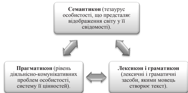
Рис. 1. Рівнева структура формування мовної особистості

Головна відмінність компетентісного підходу, яка відрізняє його від інших підходів, це його інструментальність. Життєва компетентність – це орієнтир для розбудови інноваційного загальноосвітнього навчального закладу (школи життєвої компетентності) та організації в ньому навчально-виховного процесу. Необхідно виокремити такі домінанти компетентісного підходу до середньої освіти (рис. 3).