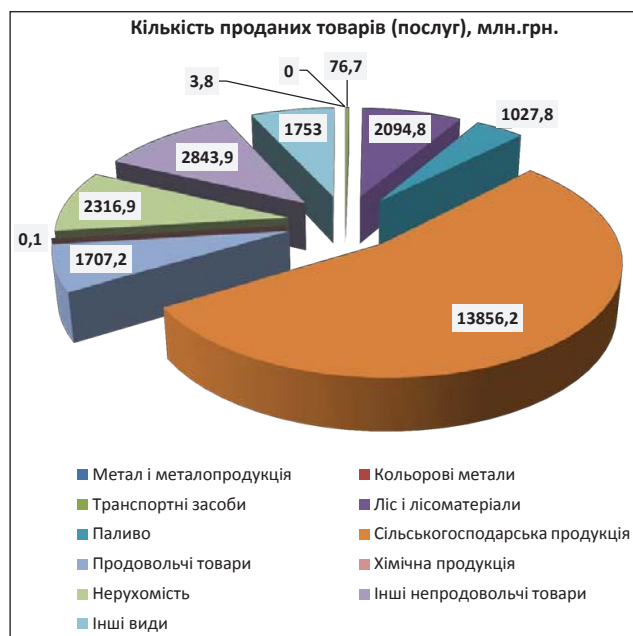
Рис. 2. Структура укладених угод за товарними групами на біржах України у 2014 році

2. Вузкість правового поля діяльності товарних бірж. Через недостатнє державне регулювання біржової торгівлі торгівля багатьма товарами не є можливою. Зокрема прикладом цього може бути те, що після прийняття ЗУ «Про затвердження Типових правил біржової торгівлі сільськогосподарською продукцією» збільшилась кількість аграрних бірж, а після прийняття ЗУ «Про схвалення Концепції переходу на біржову форму продажу вугілля» збільшилась кількість товарних бірж, а також операцій з торгівлі вугілля. Тому потрібно більше законодавчих актів в цьому напрямку.