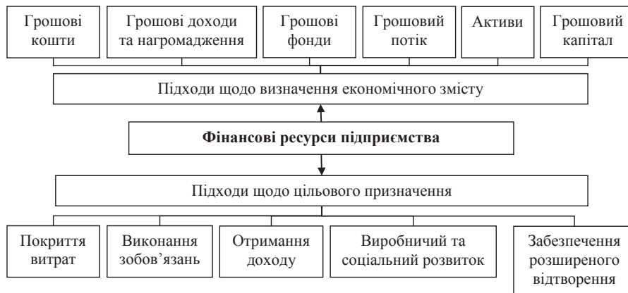
Рис. 1. Підходи до визначення та цільового призначення фінансових ресурсів

При визначенні фінансових ресурсів необхідно звернути увагу також на джерела та структуру їх створення, аналіз та оцінку доцільності їх використання. Основними з них є власні та залучені грошо-