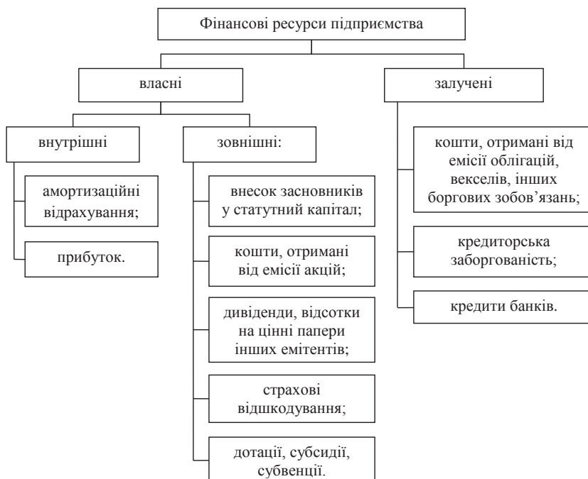
Рис. 2. Класифікація фінансових ресурсів за джерелами формування