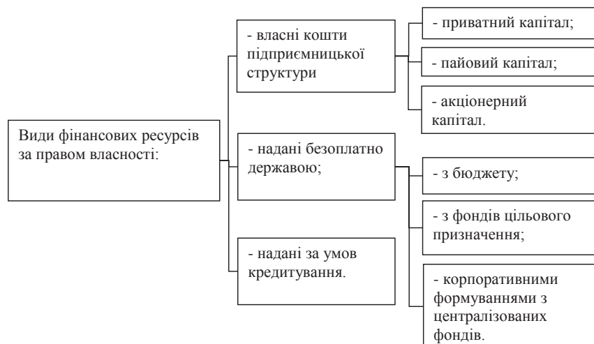
Рис. 4. Класифікація фінансових ресурсів за правом власності

За характером використання фінансові ресурси поділяються на [8, с. 145]: