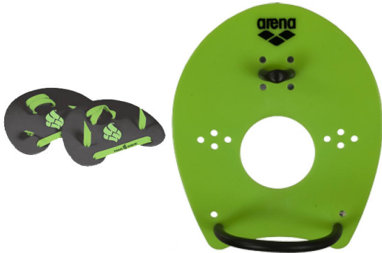
Рис. 5. Лопатки різної форми та розміру