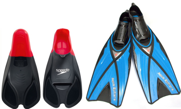
Рис. 7. Ласті різної довжини

Вправа № 1. Плавання кролем на грудях у повній координації, одягаючи манжети невеликої ваги та лопатку середнього розміру на сторону(першу – на кисть руки, другу – над суглоб нижньої кінцівки) з менш розвинутою мускулатурою. Дихальний цикл повинен припадати на слабку руку, це є дуже важливим аспектом.