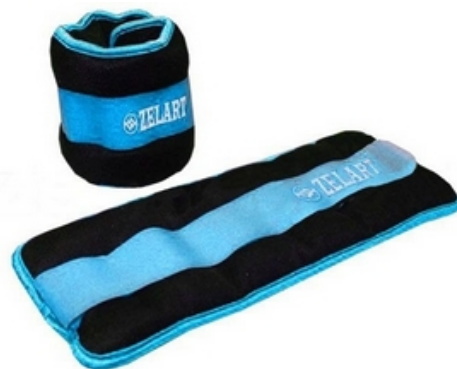
Рис. 2. Манжета