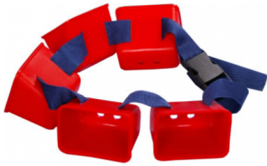
Рис. 4. Гальмівний пояс з комірками