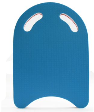
Рис. 6. Дошка для плавання