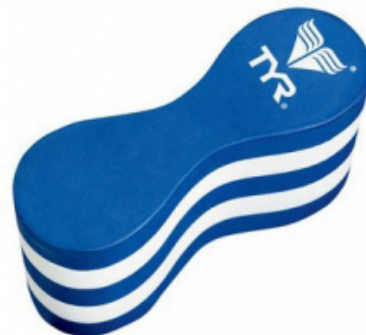
Рис. 3. Колобашка