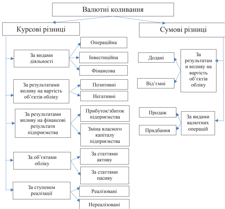
Рис. 2. Класифікація валютних коливань для цілей бухгалтерського обліку

Для внутрішнього обліку необхідна аналітична інформація щодо видів, причин виникнення та наслідків валютних коливань для діяльності підприємства, завдяки чому стане можливим прогнозування впливу валютних коливань. Отже для формування відповідної інформації для прийняття управлінських рішень щодо