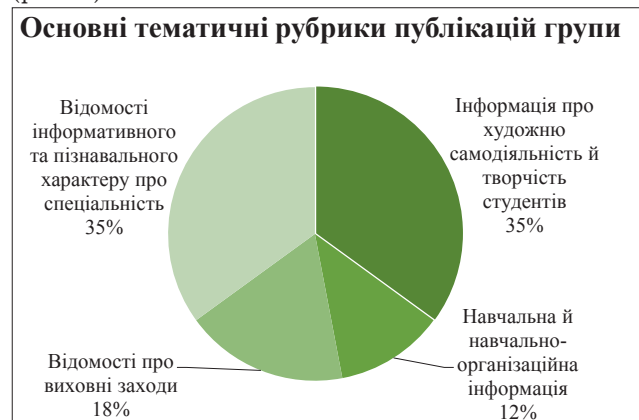
Рис. 2. Тематика публікацій у групі

Особливістю записів, здійснених у групі є те, що всі публікації містять звіт (часто фотозвіт) про проведені заходи кафедрою документознавства та інформаційної діяльності, а також анонс подій та запрошення до участі в актуальних заходах. Аналіз контенту групи дає змогу виокремити найпопулярніші рубрики серед публікацій (рис. 2).