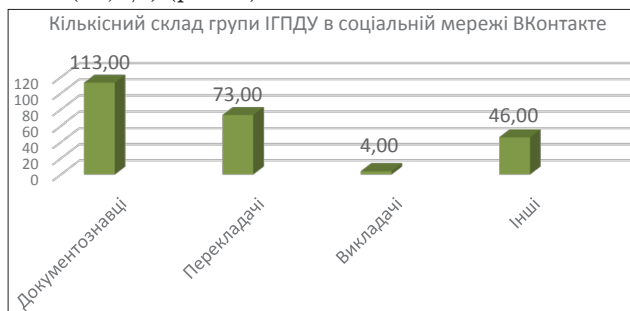
Рис. 3. Кількісний склад учасників групи ІГПДУ

Група «ІГПДУ» в соціальній мережі ВКонтакте є закритого типу, тобто, щоб долучитися до неї, користувачам потрібно подати заявку. Після того, як адміністратор підтвердить заявку, користувач зможе переглядати інформацію групи та дописувати в ній. Аналіз кількісного складу групи дав змогу виявити, що 236 учасників розподілені таким чином: 113 – студенти-документознавці (47,9%), 73 – студенти спеціальності «Переклад» (30,9%), 4 – викладачі (1,7%), 46 – інші (19,5%) (рис. 3).