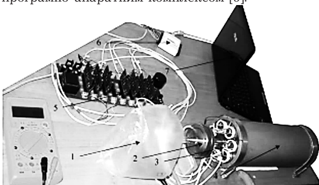
Рис. 1. Загальний вигляд ПАК:

Він реєструє концентрації газових компонентів експираторного повітря, відображає динаміку змін сигналів у режимі реального часу і зберігає всю інформацію в базі даних [4]. В загальному вигляді селективний газоаналізатор (рис. 1) є програмно-апаратним комплексом [5].