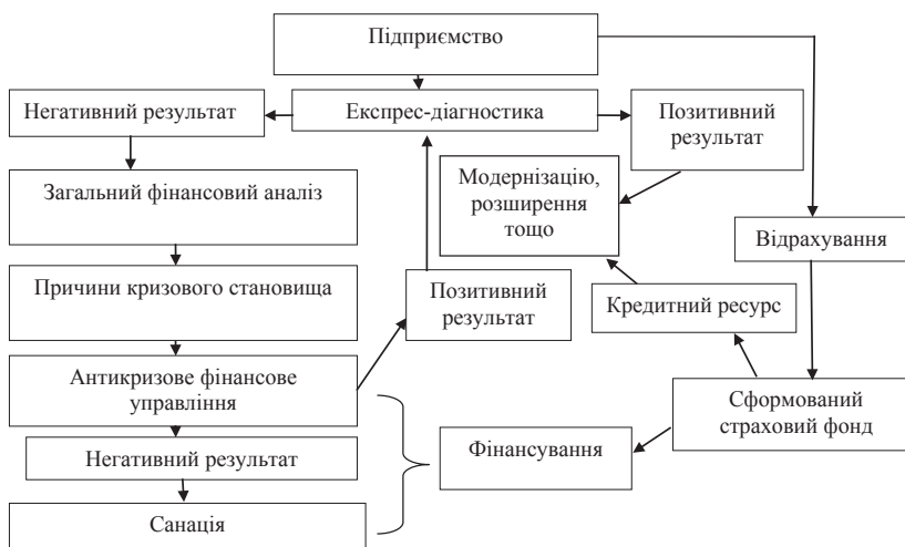
Рис. 5. Алгоритм використання страхового фонду