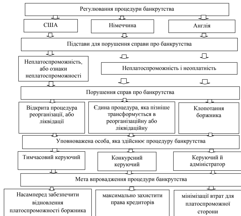
Рис. 1. Основні елементи регулювання процедури банкрутства

оскільки воно є один із засобів витіснення неконкурентних підприємств з ринку. Необхідно, зазначити що в Україні за даними рейтингу Doing Business є найгірший процес відновлення платоспроможності підприємств. Зокрема, показник середньої тривалості процедури банкрутства підприємств, за даними рейтингу, складає 2,9 років (при цьому, у розвинених країнах-членах ОЕСР – 1,7 роки), а її вартість – 42% від вартості майна боржника (9% для країн-членів ОЕСР). Українська процедура банкрутства може забезпечити лише 8,3% повернення кредиторів. Україна за вказаним рейтингом ділить з Камбоджею 161-162 місце серед 165 країн, у яких є судова процедура впровадження банкрутства. Гірше, ніж в Україні, складається ситуація для кредиторів лише у Центральноафриканській