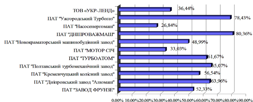
Рис. 3. Рівень зносу основних засобів у 2015 році