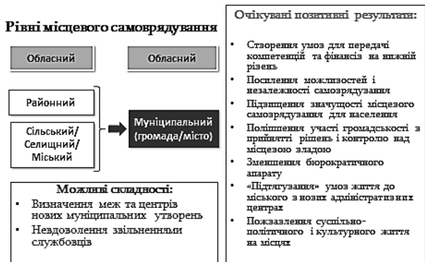
Рис. 3. Можливі шляхи реформування місцевого самоврядування