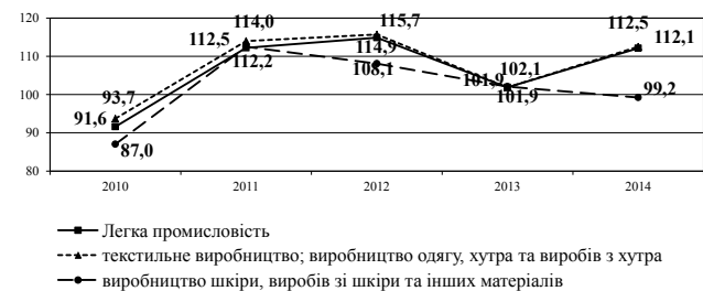
Рис. 1. Динаміка темпів зростання (спаду) обсягів реалізації продукції підприємств легкої промисловості в Україні за 2010-2014 рр., %*

Динаміку темпів зростання (спаду) обсягів реалізації продукції підприємств легкої промисловості в Україні за 2010-2014 рр. зображено на рис. 1.