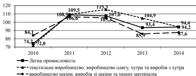
Рис. 2. Індекси виробництва продукції підприємств легкої промисловості в Україні за 2010-2014 рр., %*