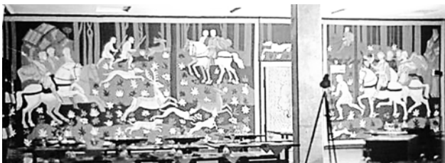
Рис. 2. Декоративне панно з гобеленів «Великокняже полювання» 1980 р. Т. Дмитренко, Л. Дмитренко

«Роль монументально-декоративного мистецтва в громадських будівлях, як пише А. Кантор, – це не абстраговане фантазування на вигадані і актуальні теми, не віртуозні варіації об'ємно-просторових побудов, а чи не сама важлива функція – знаходження шляху до людських сердець [3, с. 14]. Таким діалогом людини з мистецтвом є твори в готелі «Пролісок». В ресторані «Пролісок» з 1980 р. до сьогодні розміщені художньо-декоративні гобелени, виконані художниками Т. Дмитренко і Л. Дмитренко. На одній стіні декоративний текстиль зображує динаміку їзди верхи на конях вояків, біг собак і погоню за оленями в творі «Великокняже полювання» (1980 р.) (рис. 2). Стримані кольори надають в деякій мірі казковості цим творам, огортаючи відвідувачів роллю персонажів. На іншій стіні закомпонований твір з двох гобеленів – «Відпочинок» (1982 р.). Перший гобелен демонструє дівчину з палітрою, яка дивлячись на скульптуру, починає обмірковувати свій творчий мотив, а на другому – дівчата з юнаками відпочивають у парку, де хлопець грає на гітарі, налаштовую-