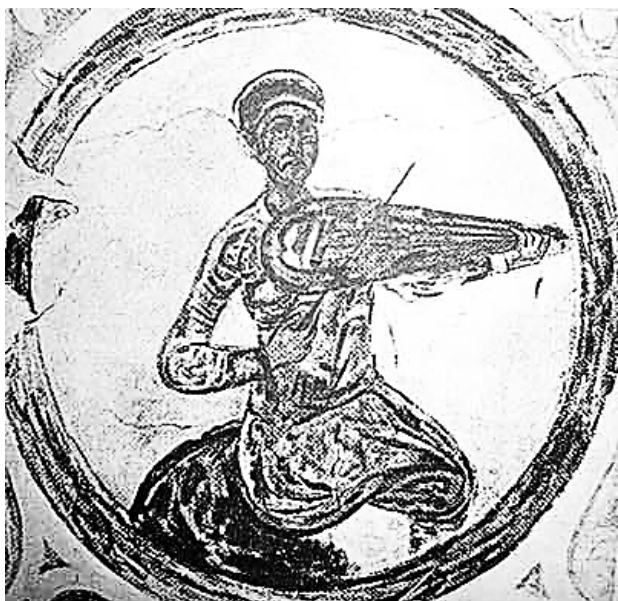
Рис. 4. Фреска з північної вежі київського Софійського Собору початку одинадцятого століття

Дослідження 1970-х рр., які зроблені на основі археологічних розкопок і іконографічних знахідок (рис. 4), свідчать про безумовний зв'язок скрипки з народним інструментарієм слов'ян.