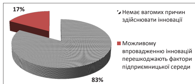
Рис. 1. Точка зору українських підприємців щодо перешкод впровадження інновацій у виробництво

Аналіз документів Державної Служби Статистики України за 2014-2017 рр. показав, що 17% підприємств в Україні не мають для себе вагомих причин здійснювати інноваційні проекти через низку причин, а саме: низький попит на інновації на ринку; низьку конкуренцію підприємства на ринку, а також відсутність хороших ідей або можливостей для інновацій [4]. Решта підприємств, яка складає 83% вважають, що розвивати інноваційні проекти їм заважали певні фактори підприємницького середовища (рис. 1).