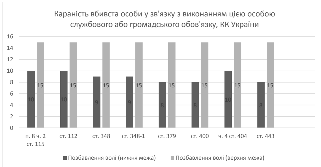
Рис. 2. Караність у КК України вбивства особи у зв'язку з виконанням цією особою службового або громадського обов'язку