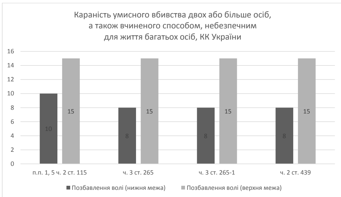
Рис. 3. Караність у КК України умисного вбивства двох або більше осіб, а також вчиненого способом, небезпечним для життя багатьох осіб

Отож про реальне посилення покарання з урахуванням положення ч. 4 ст. 68 КК України, може йтися лише у ст. 112 та ст. 348 кримінального закону України.