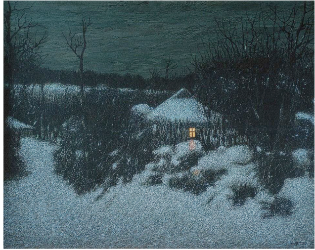
Рис. 5. І. Марчук «Ніч на Різдво», 2002 р., полотно, акрил

І хоча його відданість природі заслуговує особливої уваги, митець постійно самоудасконалюється. Він має дев'ять періодів творчості, «дев'ять Марчуків», і кожен з них глядача чимось дивує. Художник, як і кожен український митець бажає