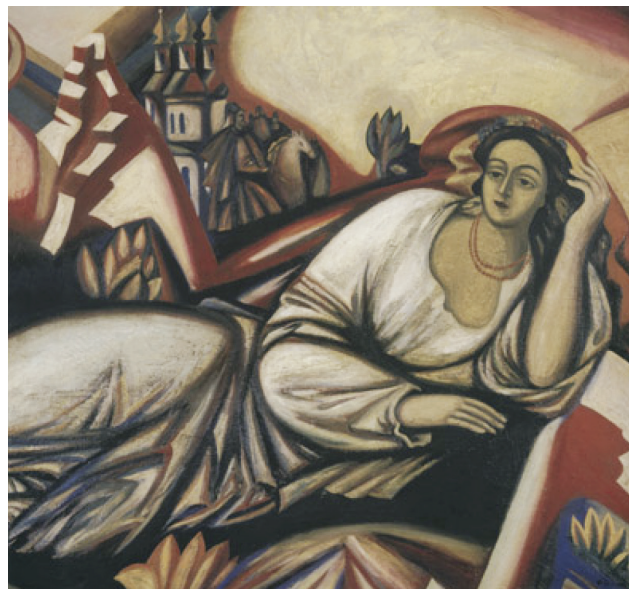
Рис. 4. Ф.М. Гуменюк «Світе тихий», 1981 р., полотно, олія.

У кожній роботі є своя історія, прадавня або новітня, відома або та яку ще потрібно розгадати. Так, наприклад, полотно «Світе тихий» (рис. 4) закомпоновано в квадратному форматі, а різка діагональ що йде з лівого нижнього кута в правий верхній та називається висхідною – створює динаміку в роботі. Висхідну діагональ також вважають діагоналлю «боротьби», яку художник вдало використав для передачі задуму. Маємо допущення, що робота написана під враженням від медитативної елегії Т. Шевченка «Розрита могила». Назва полотна художника має одноіменну назву з початком твору Т. Шевченка, та розповідає «історію» в наочних образах. Переважають червоні та чорні контрасти, темні силуети храмів та козаків-вершників, білі драперії української сорочки. В одному полотні йдуть нашарування різних історій. Складається враження, що робота має «зворотню перспективу» та має точку сходу в серці глядача.