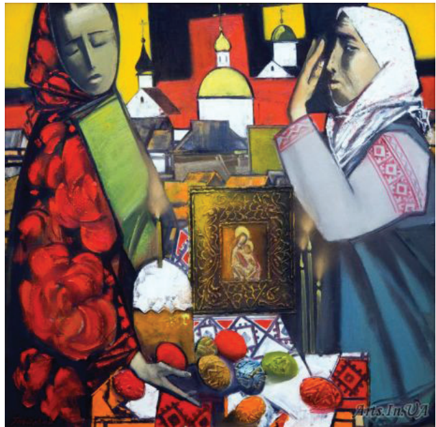
Рис. 2. С. Гнойовий «Писанки», 2013, полотно, олія

Митець обирає різні точки зору, в більшості робіт – виносить на перший план головне, найбільш суттєве. У роботах «Сільське дівча», «Полтавка», «Бузкові вечори», «Прощавайте» та у багатьох інших, автор розміщує жінку в центрі композиції. «Вона» – українська мадонна – домінанта на полотні, і в усій творчості митця протягом багатьох років жіноче начало займає центральне місце. Поступово її образ трансформується в узагальнений символ. У роботі «Писанки» (рис. 2) домінантою є теж жіночий образ – юної, сповненої мрії дівчини та мудрої бабусі. Їх об'єднує віра, образ храму на дальньому плані й ікона на передньому, контраст кольорів підсилює загальне враження, а увага до деталей і прописування українських орнаментів робить цю картину національною та близькою кожному.