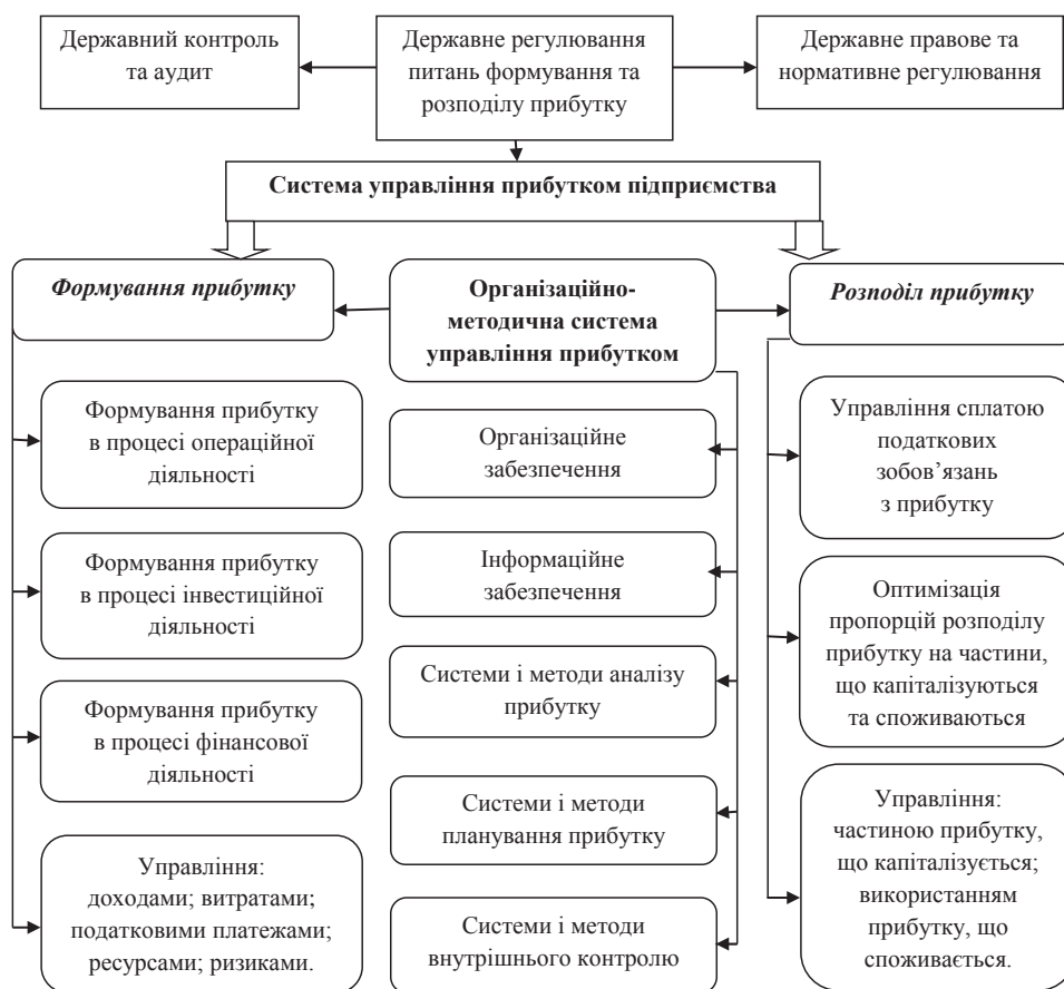
Рис. 2. Структурно-логічна схема управління прибутком підприємства