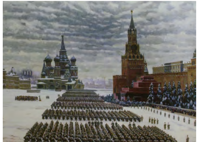
Рис. 14. К.Ф. Юон. «Парад на Красной площади в Москве 7 ноября 1941 года». 1942 г., Х., м., 69,0 X 100,0 см. // Государственная Третьяковская галерея (Москва)

В годы Великой Отечественной войны К.Ф. Юон много и упорно работал, живя все время в Москве. Любимый город представал перед ним в новом грозном облике. События первых лет войны требовали серьезного творческого осмысления. Постепенно возник замысел новой картины, посвященной Москве. Картина: «Парад на Красной площади в Москве 7 ноября 1941 года» стала одной из значительнейших в творчестве художника [6, с. 32] (рис. 14).