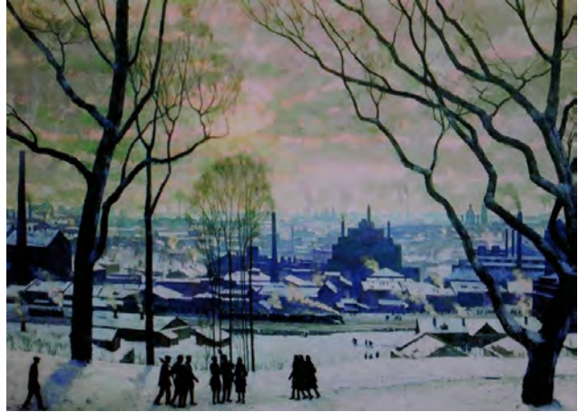
Рис. 16. К.Ф. Юон. «Утро индустриальной Москвы». 1949 г., Х., м., 134,0 X 180,0 см. // Государственная Третьяковская галерея (Москва)

ставил перед советскими художниками очень серьезные и ответственные задачи. Он считал, что советское искусство не должно ограничиваться простым иллюстрированием событий. Оно должно быть искусством большого стиля, утверждающим в совершенных художественных формах высокие идеи коммунистической морали.