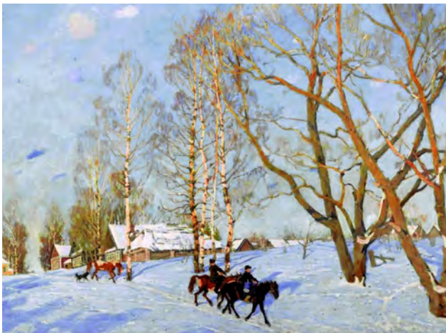
Рис. 8. К.Ф. Юон. «Мартовское солнце. Лигачево». 1915 г., Х., м., 107,0 X 142,0 см. // Государственная Третьяковская галерея (Москва)

Во все периоды своей художественной деятельности К.Ф. Юон с увлечением писал скромную и прекрасную среднерусскую природу. Любимой темой художника была ранняя весна. Радостный момент пробуждения природы от зимнего сна, когда очень чист воздух, ярка лазурь неба, когда все пронизано солнечными лучами, а сине-белый снег по-особенному хрустит под ногами, тот самый момент, который М.М. Пришвин метко назвал «весна света» явился темой его пейзажа: «Мартовское солнце. Лигачево» (1915) [6, с. 20] (рис. 8).