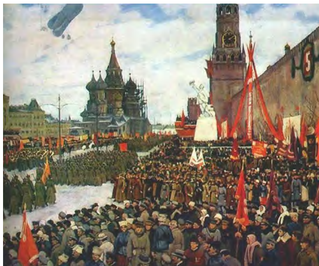
Рис. 11. К.Ф. Юон. «Парад Красной Армии». 1923 г., Х, м., 89,5 X 111,5 см. // Государственная Третьяковская галерея (Москва)

пятилетие великой победы. Строгие ряды марширующих солдат, блеск труб оркестра, алый цвет знамен и плакатов, пестрая праздничная толпа, любующаяся парадом войск, величественная красота архитектуры Кремля и храма Василия Блаженного – все это придает картине праздничный, приподнятый характер.