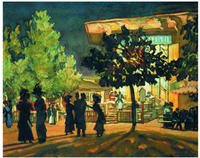
Рис. 3. К.Ф. Юон. «Ночь. Тверской бульвар». 1909 г. Бумага, акварель, белила, карандаш, 62,0 X 75,0 см. // Государственная Третьяковская галерея (Москва)

В конце 1900-х годов К.Ф. Юон увлеченно работает над серией картин, в которых ставит перед собой задачу передать эффект ночного освещения. Это картины: «Ночь. Тверской бульвар» (1909), «Тройка у старого Яра. Зима» (1909) и другие [6, с. 14] (рис. 3, 4).