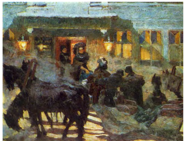
Рис. 4. К.Ф. Юон. «Тройка у старого Яра. Зима». 1909 г., Х, м., 71,0 X 89,0 см. // Государственный музей изобразительных искусств Киргизстана (Бишкек)

В первой из них на фоне ярко освещенного ночного кафе вырисовываются причудливые, чуть гротескные силуэты его посетителей –