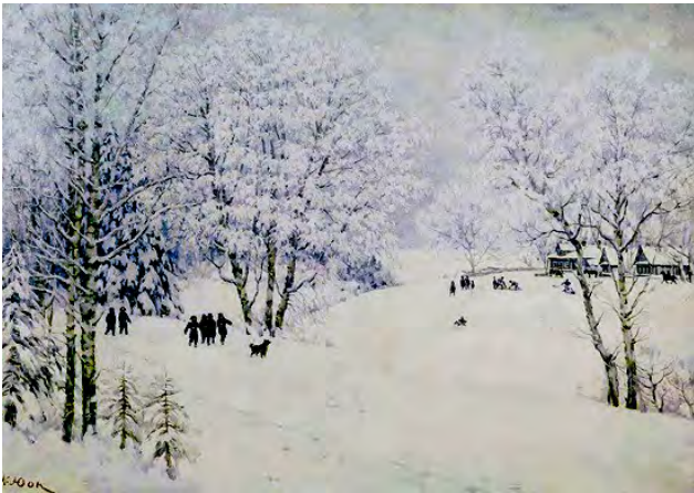
Рис. 15. К.Ф. Юон. «Русская зима. Лигачево». 1947 г., Х., м., 132,0 X 185,0 см. // Государственная Третьяковская галерея (Москва)

живет в Лигачеве и много трудится. В «Русской зиме. Лигачево» (1947) К.Ф. Юон выступает подлинным поэтом русской природы [6, с. 34] (рис. 15).