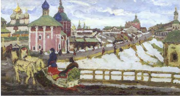
Рис. 1. К.Ф. Юон. «К Троице». 1903 г., Х, м., 53,0 X 103,0 см. // Государственная Третьяковская галерея (Москва)

Одним из первых произведений, посвященных этой теме, была картина: «К Троице» (1903) [6, с. 13] (рис. 1).