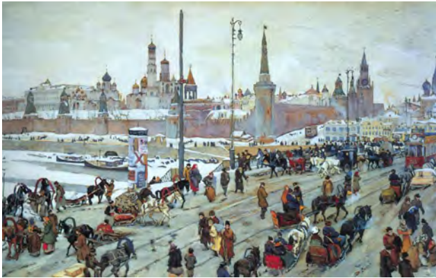
Рис. 7. К.Ф. Юон. «Москворецкий мост. Зима». 1911 г. Бумага, акварель, белила, 62,5 X 167,5 см. // Государственная Третьяковская галерея (Москва)

вые приказчики, важные купцы, лихие извозчики и медленно плетущиеся ломовики. Все это изображено очень живо, непосредственно, метко. Прозрачная ясность и мягкость тонов акварельных красок, легкая воздушная дымка смягчают контуры панорамного пейзажа и пестроту колорита. В этой работе, как и в ряде других того времени, К.Ф. Юон проявил себя талантливым мастером-акварелистом.