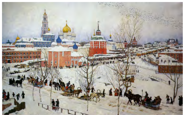
Рис. 6. К.Ф. Юон. «Троицкая лавра зимой». 1910 г., Х., м., 125,0 X 198,0 см. // Государственный Русский музей (Санкт-Петербург)

Для К.Ф. Юона всегда была характерна любовь к эпическим пейзажам, широким, торжественным, рисующим старую русскую архитектуру и новую, кипящую вокруг нее жизнь. К числу таких пейзажей относится большой холст: «Троицкая лавра зимой» (1910) [6, с. 19] (илл. 6).