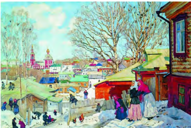
Рис. 5. К.Ф. Юон. «Весенний солнечный день». 1910 г., Х., м., 87,0 X 131,0 см. // Государственный Русский музей (Санкт-Петербург)

В 1908 году К.Ф. Юон поселился в Лигачеве. Здесь он жил подолгу во все времена года. «...Я имел возможность еще ближе подойти к народу и народной жизни, в частности, к жизни деревни, которая немало питала и питает мое искусство» [7, с. 38]. В 1910 году К.Ф. Юон написал одну из лучших своих работ, посвященных Троицкой лавре, – картину: «Весенний солнечный день» [6, с. 16] (рис. 5).