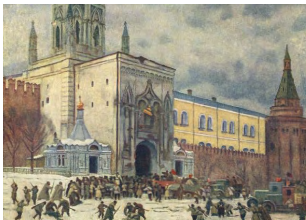
Рис. 12. К.Ф. Юон. «Штурм Кремля в 1917 году». 1947 г., Х, м., 70,0 X 101,0 см. // Государственная Третьяковская галерея (Москва)

Темой нескольких юоновских акварелей конца 1920-х годов стали события, происходившие в Москве в ноябре 1917 года, когда рабочие и солдаты штурмом брали Кремль, захваченный юнкерами. Акварель «Вступление в Кремль через Никольские ворота» (1926) рисует напряженный момент борьбы за Кремль: революционный народ атакует кремлевские ворота [6, с. 29]. И хотя фигуры людей даны почти силуэтно, они очень выразительны. Художнику удалось в этой работе передать революционный, боевой дух времени. В дальнейшем эту же тему К.Ф. Юон повторил в картине: «Штурм Кремля в 1917 году» (1947) [6, с. 29] (рис. 12).