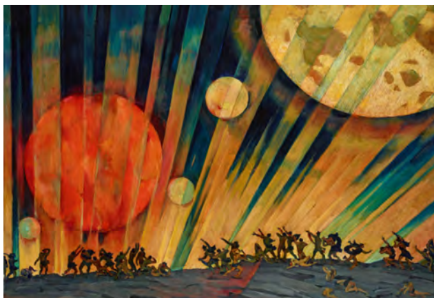
Рис. 10. К.Ф. Юон. «Новая планета». 1921 г., Темпера, картон, 71,0 X 100,0 см. // Государственная Третьяковская галерея (Москва)

Первые произведения К.Ф. Юона на революционные темы носили символично-аллегорический характер. В картине: «Новая планета» (1921) К.Ф. Юон представил рождение революционной эпохи в отвлеченно-фантастическом образе: над земным шаром в космическое пространство поднимается раскаленная красная планета (рис. 10).