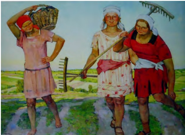
Рис. 13. К.Ф. Юон. «Молодые. Смех». 1930 г., Х., м., 94,0 X 134,0 см. // Государственный Русский музей (Санкт-Петербург)

Творчество К.Ф. Юона стало более целеустремленным. В его произведениях появляются характерные, типические образы советских людей. Таковы его картины: «Молодые. Смех» (1930) и «Подмосковная молодежь» (1926) [6, с. 29] (рис. 13).