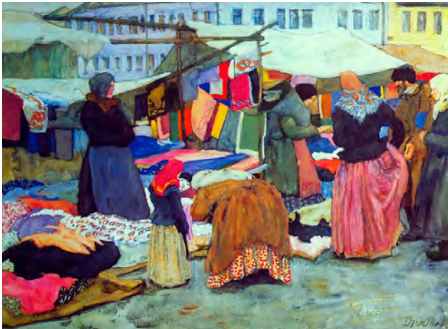
Рис. 2. К.Ф. Юон. «Красный товар. Ростов Великий». 1905 г., Бумага, акварель, белила, 49,0 X 65,0 см. // Государственная Третьяковская галерея (Москва)

О тонкой наблюдательности молодого художника свидетельствовала картина: «Красный товар. Ростов Великий» (1905), изображающая уголок базарной площади в Ростове Великом [6, с. 13] (рис. 2).