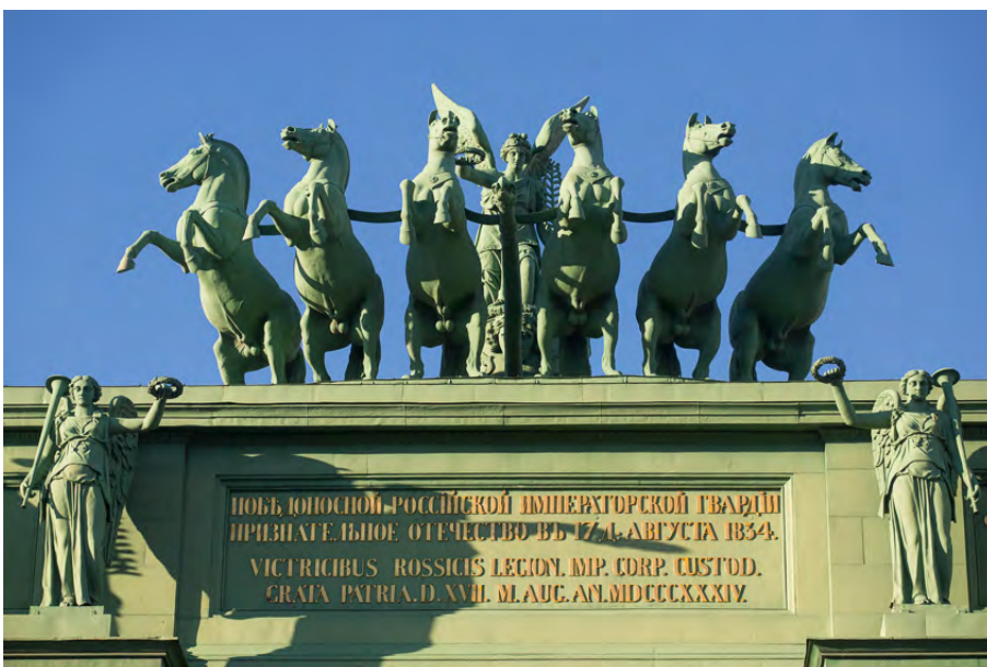
Илл. 11. С.С. Пименов. «Колесница Славы на аттике арки Нарвских триумфальных ворот». Листовая медь. 1830–1833 гг.

В результате мужественного упорства С.С. Пименова, не желавшего оставлять своего дела по царской прихоти, а также целого ряда других проявлений дружбы и поддержки со стороны своих товарищей, С.С. Пименову удается довести до конца почти все начатые им работы, за исключением фигур коней на Нарвских триумфальных воротах (их исполнение было передано скульптору