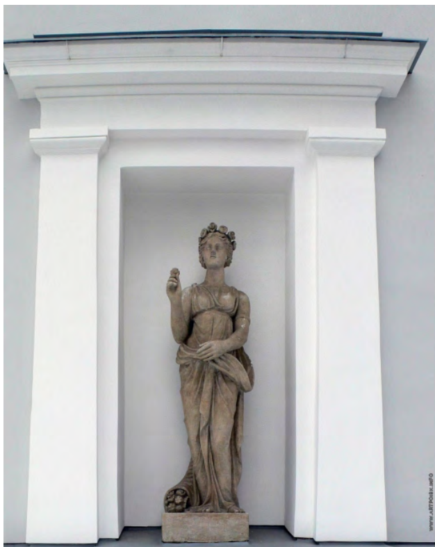
Илл. 7. С.С. Пименов. «Флора». 1822 г. Пудостский камень // Елагиноостровский дворец-музей (Санкт-Петербург)

турный ансамбль столицы. К.И. Росси, которому в 1819 году было поручено «устройство против Зимнего дворца правильной площади», блестяще справился с возложенной на него задачей [8, с. 24]. Замысел К.И. Росси поражает нас предельной простотой, за которой скрывается глубоко продуманное, гениальное решение. Зимнему дворцу противопоставляется грандиозное по размаху полуциркульное сооружение, состоящее из двух зданий, соединенных аркою, с плоскими фасадами по сторонам. Архитектор сосредотачивает все внимание зрителя на великолепной двойной арке.