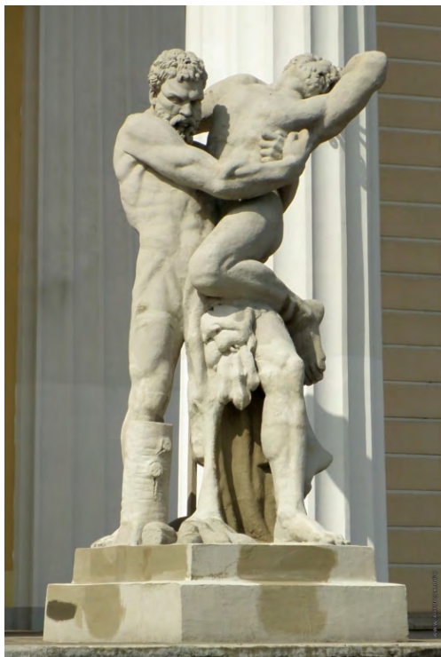
Илл. 4. С.С. Пименов. «Геркулес и Антей. Группа перед портиком Горного института». Пудостский камень. 1809–1811 гг.