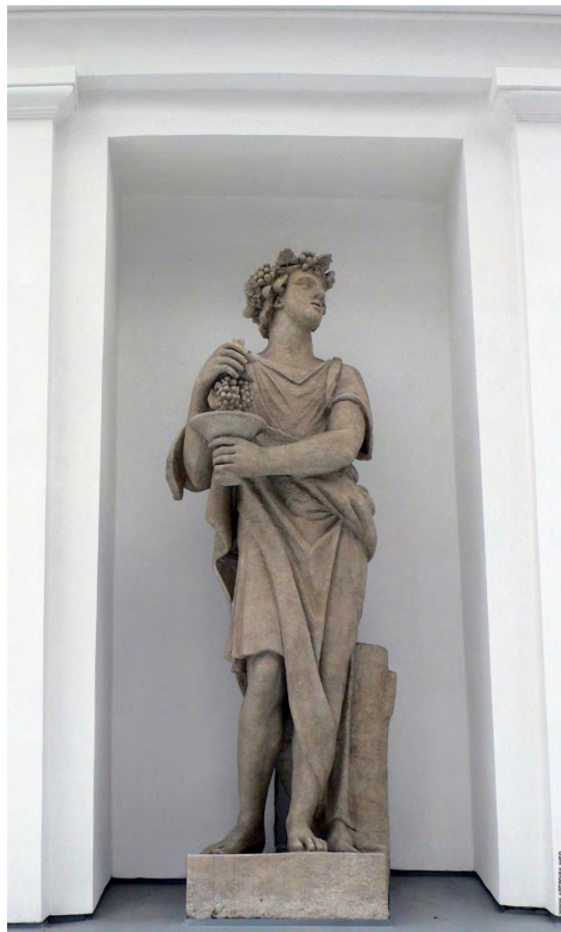
Илл. 8. С.С. Пименов. «Вакх». 1822 г. Пудостский камень // Елагиноостровский дворец-музей (Санкт-Петербург)