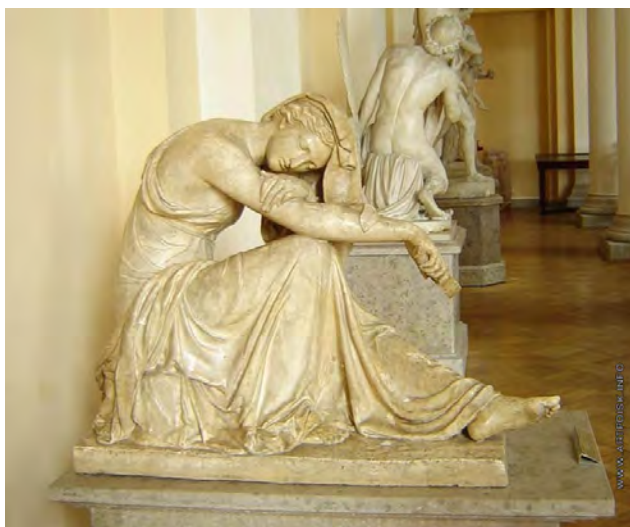
Илл. 1. С.С. Пименов. «Проект надгробного памятника М.И. Козловскому». Гипс. 1802 г. // Государственный Русский музей (Санкт-Петербург)

Основными конкурентами оказались С.С. Пименов и В.И. Демут-Малиновский – молодой, уже окончивший Академию скульптор, с которым С.С. Пименова будет связывать в дальнейшем многолетняя дружная работа. С.С. Пименовым была представлена модель круглой скульптурной фигуры в виде печально сидящей женщины, В.И. Демут-Малиновским – барельефная композиция, изображающая гения смерти, опирающегося на мраморный торс и гасящего факел жизни (илл. 1).