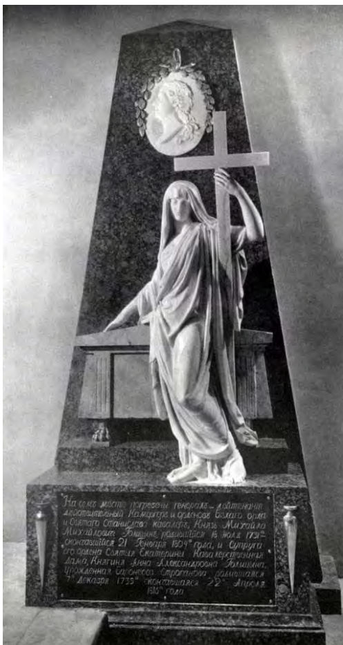
Илл. 5. С.С. Пименов. «Надгробный памятник М.М. Голицыну». Мрамор, гранит, золоченая медь. 1810 г. // Государственный музей архитектуры имени А.В. Щусева (Москва)

исследована и мало известна. Еще продолжая работу над скульптурными произведениями для Казанского собора, Степан Степанович Пименов создает крупное произведение, которое также предназначалось для архитектурного памятника.