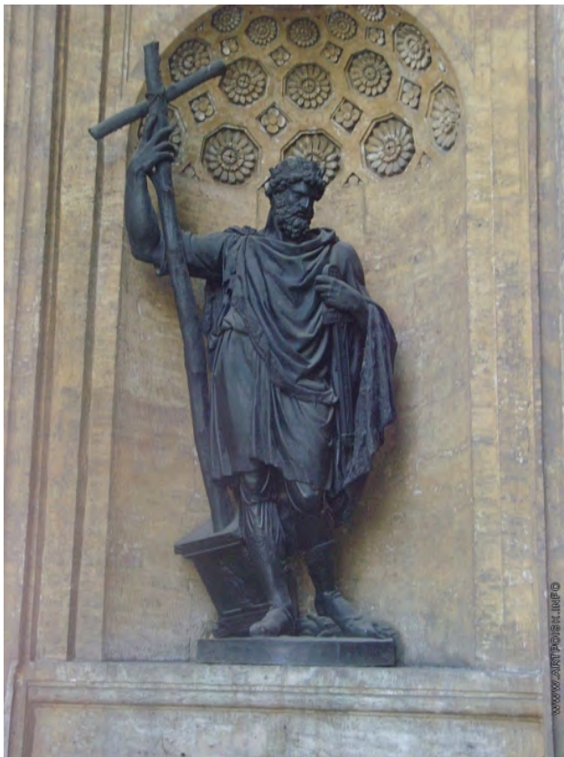
Илл. 2. С.С. Пименов. «Владимир. Статуя в нише северного портика Казанского собора». Бронза. 1804–1807 гг.

Вторая статуя, созданная С.С. Пименовым (она была отлита к 1811 году, к открытию Казан-