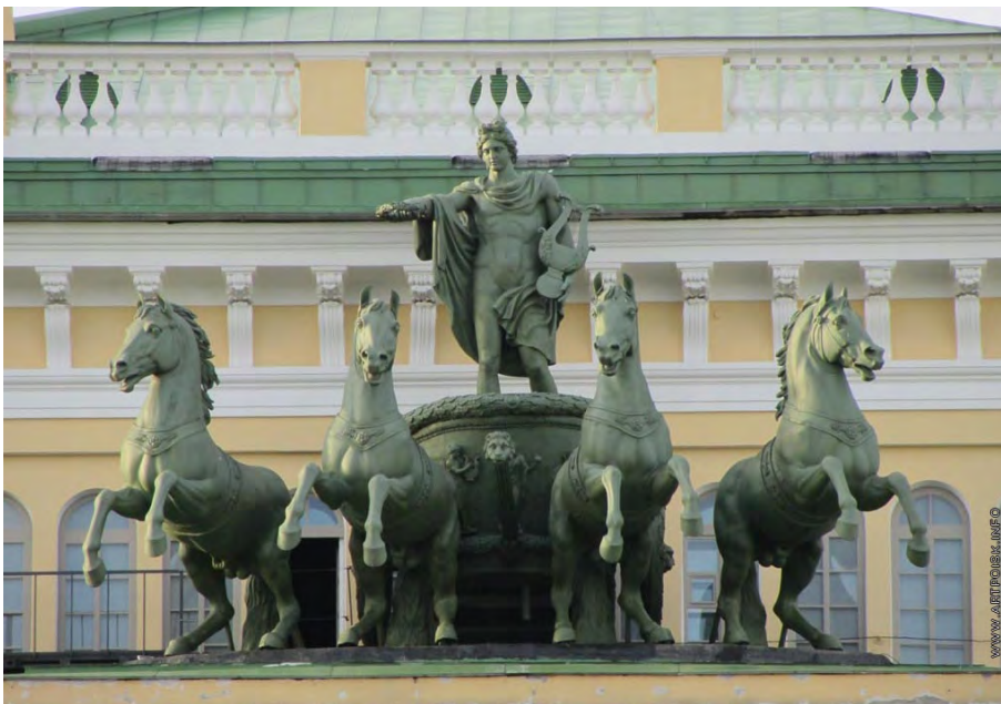
Илл. 10. С.С. Пименов. «Колесница Аполлона на аттике Александринского театра». Листовая медь. 1831–1832 гг.

принципу деления их поровну, т.е. модели коней к правому воину создавались С.С. Пименовым, а к левому – В.И. Демут-Малиновским.