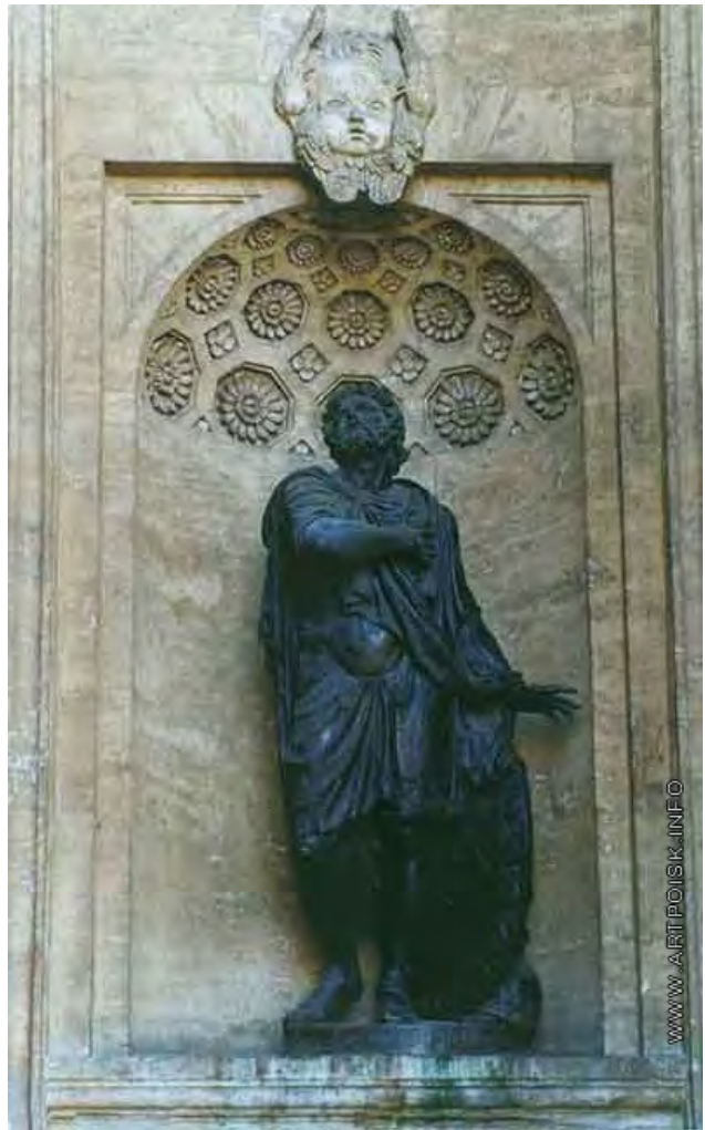
Илл. 3. С.С. Пименов. «Александр Невский. Статуя в нише северного портика Казанского собора». Бронза. 1807–1811 гг.

Самый процесс отливки статуй для Казанского собора был специально подробно описан вице-президентом Академии художеств П.П. Чекалевским (1751–1817 гг.) в книге: «Опыт ваяния из бронзы одним приемом колоссальных статуй»