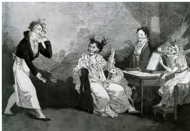
Илл. 5. А.Г. Венецианов. «Французский парикмахер». 1812 г. Офорт, раскраска акварелью, 27,0 x 20,0 см // Государственный Русский музей (Санкт-Петербург)

Картиной: «Гумно» и целым рядом других произведений из деревенской жизни художник утвердил крестьянский жанр в русском искусстве XIX века [3, с. 17]. Но, А.Г. Венецианов не ограничился лишь введением новых тем. Он су-