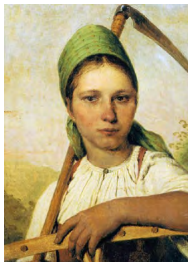
Илл. 10. А.Г. Венецианов. «Крестьянка с косой и граблями (Пелагея)». Не позднее 1824 года. Х., м., 22,5 x 17,5 см // Государственный Русский музей (Санкт-Петербург)

А.Г. Венецианов здесь затрагивает художественную задачу, новую для его эпохи: в картине создается впечатление случайности позы, безыскусственности, которая заставляет предположить, что Захарка не чувствует на себе взгля-