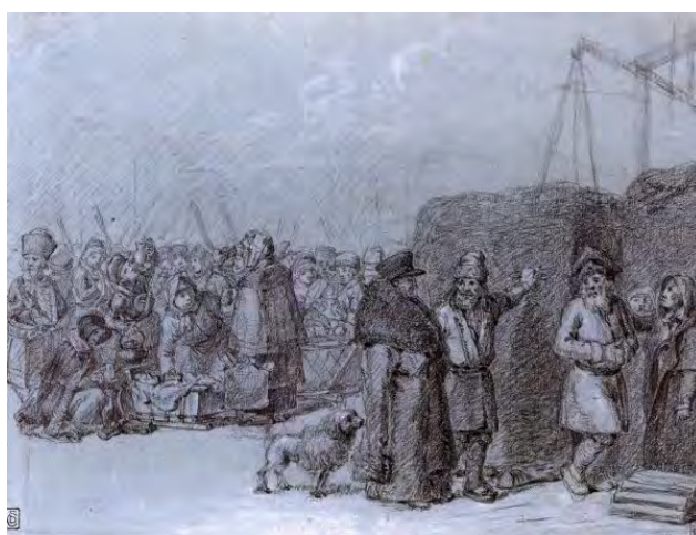
Илл. 6. А.Г. Венецианов. «На сеном рынке». 1823–1826 гг. Рисунок // Государственный Русский музей (Санкт-Петербург)