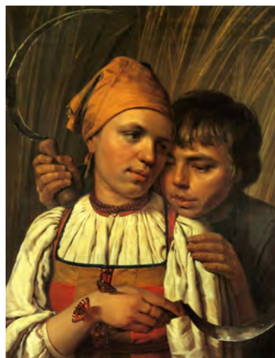
Илл. 11. А.Г. Венецианов. «Жнецы». Конец 1820-х годов. Х., м., 52,0 x 66,0 см // Государственный Русский музей (Санкт-Петербург)