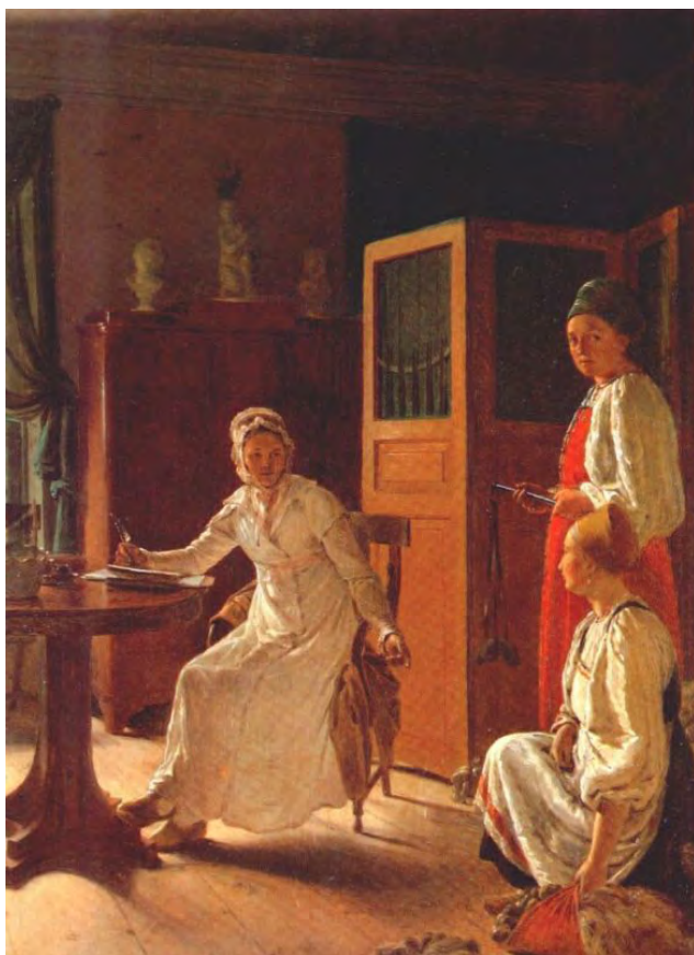
Илл. 8. А.Г. Венецианов. «Утро помещицы (Помещица, занятая хозяйством)». 1823 г. Дерево, масло, 41,5 x 32,5 см // Государственный Русский музей (Санкт-Петербург)

В России, до появления картин А.Г. Венецианова, крестьянский жанр еще до конца не сформировался. Хотя, творчество таких мастеров XVIII века, как И.А. Ерменев, М. Шибанов, И.М. Тонков, и свидетельствует об интересе