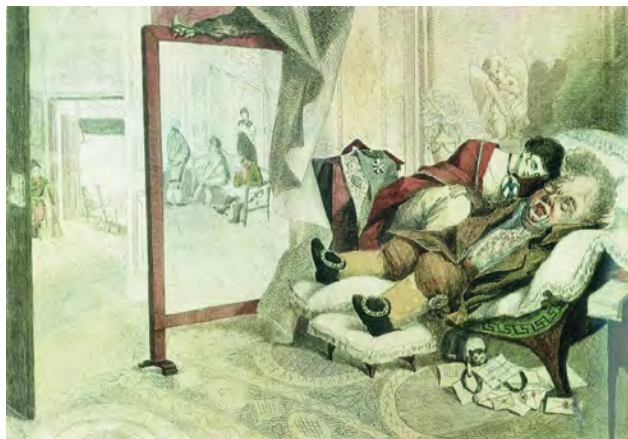
Илл. 4. А.Г. Венецианов. «Вельможа». 1807 – начало 1808 года. Офорт, раскраска акварелью // Государственный Русский музей (Санкт-Петербург)

А.Г. Венецианов стремился своим журналом в какой-то мере содействовать очищению современного ему общества от пороков и воспитанию его в «лучших понятиях» [3; 10]. Для этого требовалась не только большая честность и принципиальность, но и решительность и смелость. А.Г. Венециановым был составлен план издания, намечены темы, получено разрешение на выпуск журнала. Более того, уже вышли два листа, но в момент выхода третьего, издание неожиданно было запрещено Императором Александром I. А.Г. Венецианов был вызван цензурным комитетом, и ему пришлось представить все имеющи-