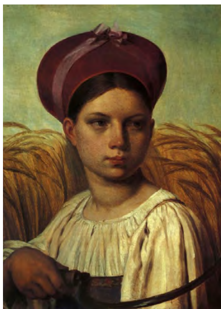
Илл. 9. А.Г. Венецианов. «Жница». Не позднее 1826 г. Х., м., 24,0 x 30,0 см // Государственный Русский музей (Санкт-Петербург)

к крестьянским образам, в целом о крестьянском жанре, как таковом, еще говорить было рано. В течение ближайшего десятилетия А.Г. Венецианов разрабатывал темы крестьянского и бытового жанра и создал несколько различных типов картин. Это бытовые сценки в узком смысле слова, погрудные или поясные изображения отдельных фигур крестьян и, наконец, те же бытовые сцены, но решенные в более приподнятом, монументальном характере при известной статичности персонажей.