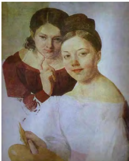
Илл. 18. А.Г. Венецианов. «Портрет дочерей художника А.А. и Ф.А. Венециановых. Первая половина 1830-х годов. Х., м., 64,0 x 50,0 см // Государственный Русский музей (Санкт-Петербург)

Оставшийся незавершенным, он пленяет нас не только удивительной теплотой, с которой, стареющий художник изобразил своих дочерей, но и дает возможность ближе познакомиться с творческим методом А.Г. Венецианова. Мастер работает, легко накладывая краски полужидким, тонким слоем, быстро и верно, находя нужный ему оттенок цвета. Он пишет по кускам, по частям, постепенно заполняя живописью холст, не прибегая к подмалевку, обычной первоначальной стадии работы большинства живописцев. Работать так можно лишь в том случае, когда заранее ясно представляешь себе общую колористическую гамму произведения.