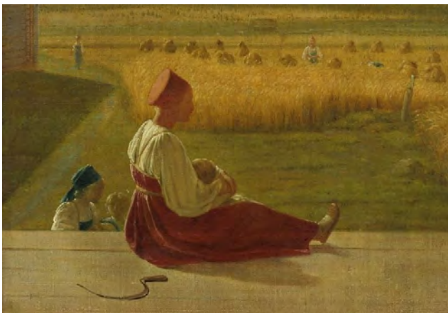
Илл. 16. А.Г. Венецианов. «На жатве. Лето». Середина 1820-х годов. Х., м., 60,0 x 48,3 см // Государственная Третьяковская галерея (Москва)

Многое сближает «На жатве. Лето» с одновременно написанным – «На пашне. Весна» [3, с. 41]. И это, прежде всего, изображение в качестве главной темы времени года, причем не отвлеченно, не посредством введения аллегорий, как это было свойственно академическому искусству, а через показ полевых работ с включением фигур работающих и отдыхающих крестьян.