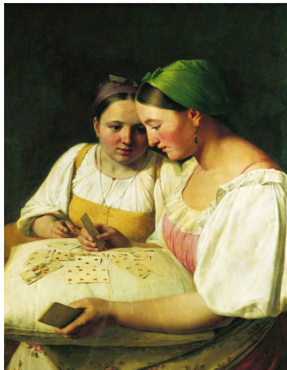
Илл. 19. А.Г. Венецианов. «Гадание на картах». 1842 г. Х., м., 68,0 x 52,0 см // Государственный Русский музей (Санкт-Петербург)

Эти работы, как и раньше, написаны твердой рукой, в обычном для художника колорите. Вместе с тем в 1840-е годы у А.Г. Венецианова появляются и более случайные произведения, и про-