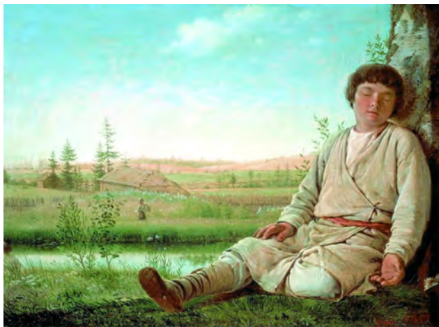
Илл. 14. А.Г. Венецианов. «Спящий пастушок». 1823–1826 гг. Дерево, масло, 27,5 x 36,5 см // Государственный Русский музей (Санкт-Петербург)