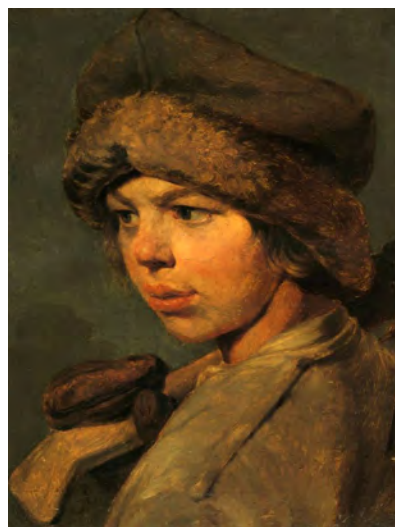
Илл. 12. А.Г. Венецианов. «Захарка». 1825 г. Х., м., 30,0 x 39,0 см // Государственная Третьяковская галерея (Москва)