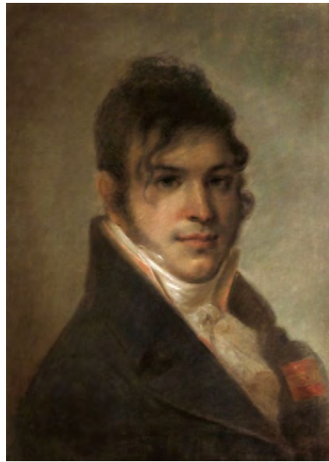
Илл. 1. А.Г. Венецианов. «Портрет А.И. Бибикова». 1807–1809 гг. Бумага, пастель, 42,0 x 54,0 см // Государственный Русский музей (Санкт-Петербург)

Это сравнительно небольшая работа написана в реалистической манере. К зрителю обращено умное, внимательное лицо, с пристальным, сосредоточенным взглядом; А.Г. Венецианов кажется старше своих лет (ему в это время было около тридцати одного года). В портрете, прежде всего, привлекает внутренняя значительность, отразившаяся и во внешнем облике изображенного. Формы лица вылеплены светом, колорит сдержан, построен на коричневатых и зеленоватых тонах. Хотя, автопортрет выполнен маслом, особая мягкость живописной манеры позволяет вспомнить более ранние пастельные его произведения.