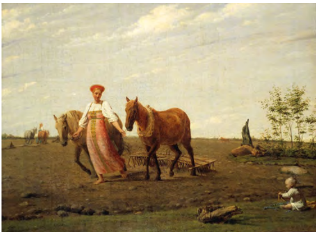
Илл. 15. А.Г. Венецианов. «На пашне. Весна». Первая половина 1820-х годов. Х., м., 65,5 x 51,2 см // Государственная Третьяковская галерея (Москва)