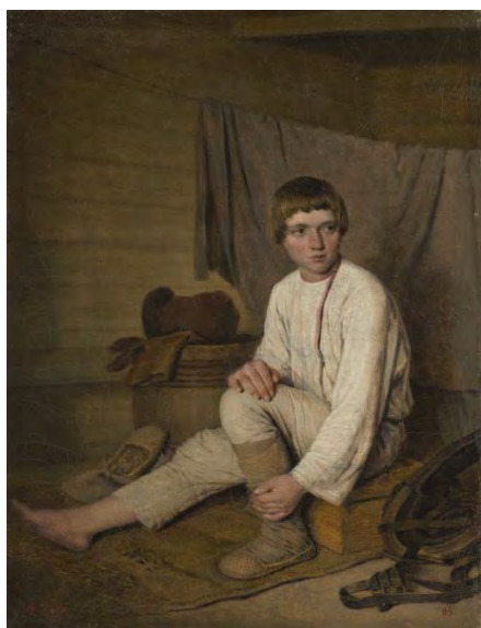
Илл. 13. А.Г. Венецианов. «Крестьянский мальчик, надевающий лапти». 1823–1826 гг. Х., м., 28,0 x 37,0 см // Государственный Русский музей (Санкт-Петербург)

Приехав в 1824 году в Петербург, А.Г. Венецианов столкнулся со сложной ситуацией. С одной стороны, ему было оказано большое внимание не кем иным, как самим царем Александром I, приобретшим с целью поддержки художника три его картины: «Гумно», «Очищение свеклы» и «Утро помещицы» [3, с. 29]. Но, вместе с тем художественные круги, и, прежде всего, Академия художеств, встретили А.Г. Венецианова почти враждебно.