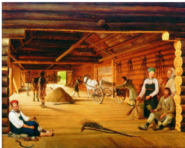
Илл. 7. А.Г. Венецианов. «Гумно». 1821–1823 гг. Х., м., 80,5 x 66,5 см // Государственный Русский музей (Санкт-Петербург)

мел увидеть в русских крестьянах достоинство человеческой личности, красоту, душевную чистоту, большую силу. Его искусство возвышает образы простых людей, тружеников.