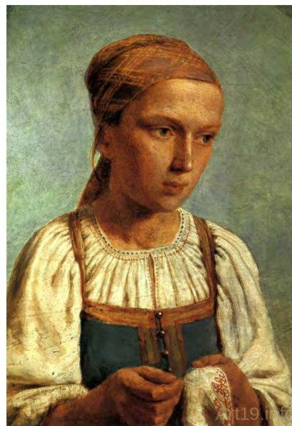
Илл. 20. А.Г. Венецианов. «Крестьянская девушка за вышиванием». 1843 г. Картон, масло, 27,0 x 21,0 см // Государственная Третьяковская галерея (Москва)

сто слабые в художественном отношении. Среди лучших картин 1840-х годов – это «Гадание на картах», «Девушка с гармоникой», «Крестьянская девушка за вышиванием» [3, с. 44] (илл. 18, 19).