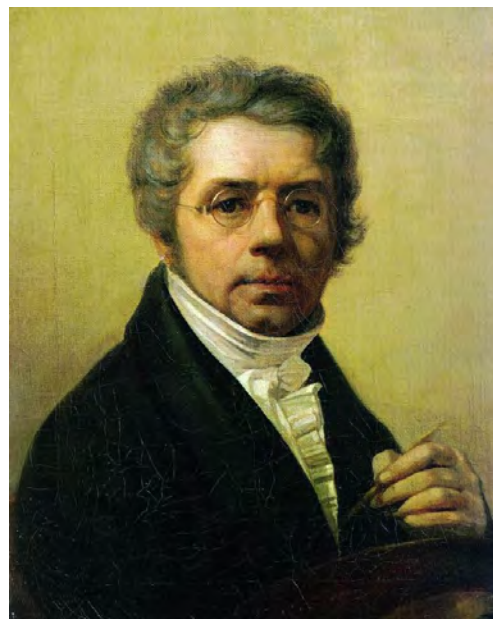
Илл. 2. А.Г. Венецианов. «Автопортрет». 1811 г. Х., м., 67,5 x 56,0 см // Государственная Третьяковская галерея (Москва)

Почти одновременно с автопортретом был написан портрет инспектора Академии художеств К.И. Головачевского (1811), созданный в более традиционной, академической манере, связанной с живописью XVIII века (илл. 3).