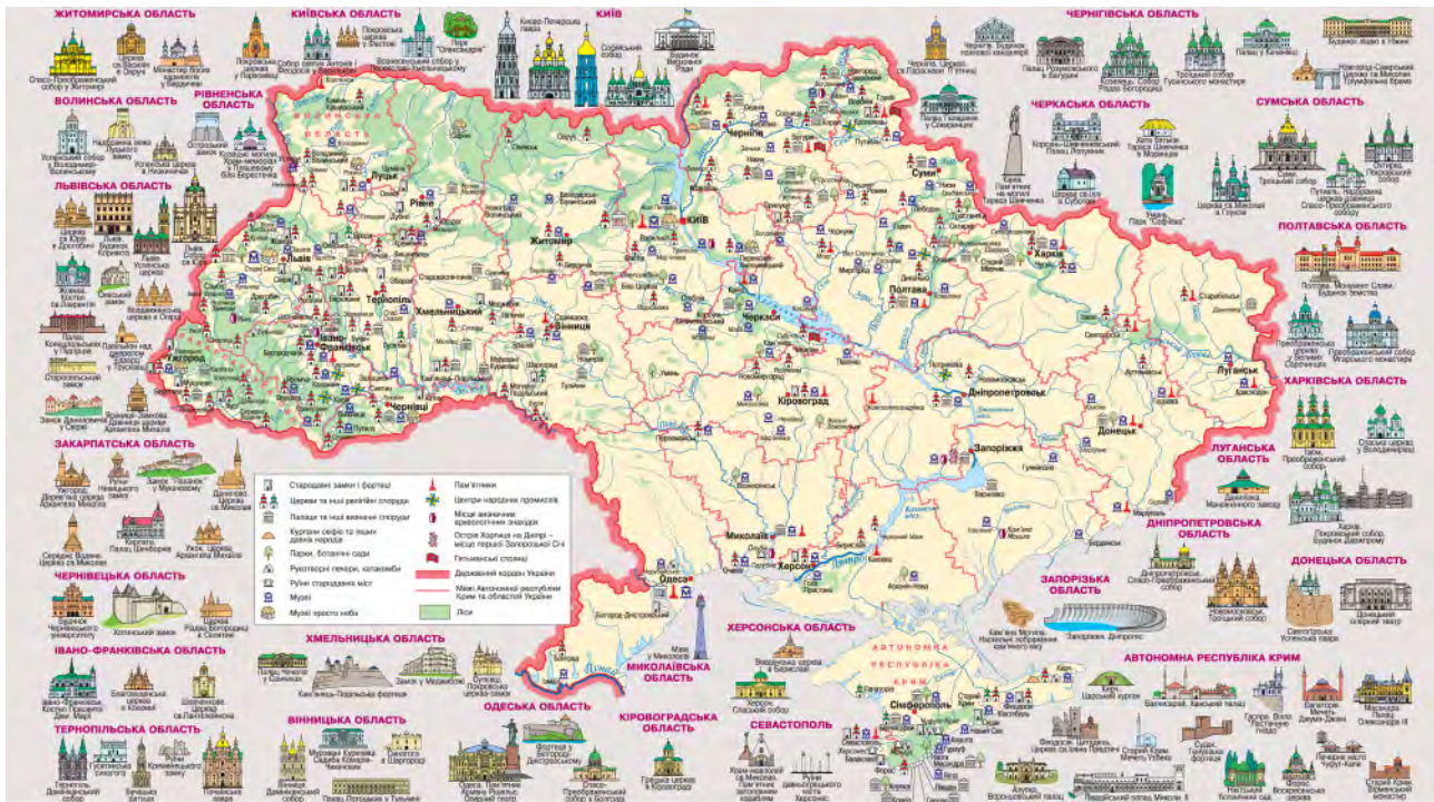
Рис. 3. Історико-культурна спадщина України [3]