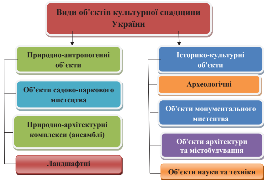
Рис. 1. Схема класифікації видів культурної спадщини України

Створено 63 історико-культурні (архітектурні, археологічні) заповідники (з них 13 – національні).