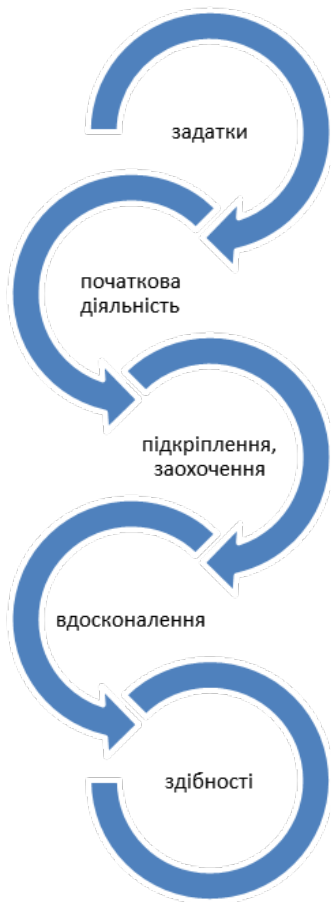
Рис. 2. Механізм формування покликання на етапах дорослішання

не враховує якості самої особистості, а також те, що людина в процесі діяльності змінює навколишній світ [15]. Згідно принципу реципрокного детермінізму поведінка, зовнішнє середовище й індивід є взаємодетерміновані [15]. Опіраючись на дослідження А. Бандури та Ф. Скінера, ми пропонуємо механізм висхідної спіралі, згідно якого дитина яка має певні задатки на початкових стадіях, а тому має більше шансів отримувати більше заохочення. В результаті отримання заохочення вона буде продовжувати діяльність, під час чого задатки будуть переходити в здібності. Наприклад, дитина, яка почала відвідувати спортивну секцію з боксу при наявності задатків відразу досягає певних успіхів і зацікавлює тренерів. Це призводить до продовження занять, в яких задатки розвиваються і дозволяють отримувати подальші заохочення, а ті, в свою чергу, стимулюють до подальших занять (див. рис. 2).