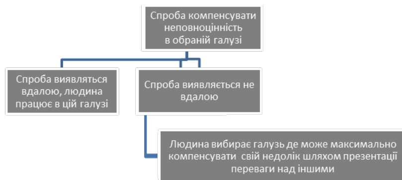
Рис. 1. Механізм формування покликання з точки зору персональної психології

Згідно оперантного навчіння дитина буде повторювати ту діяльність, в результаті якої отримує заохочення. Даний принцип загалом відображає формування схильності до певного виду діяльності. Однак