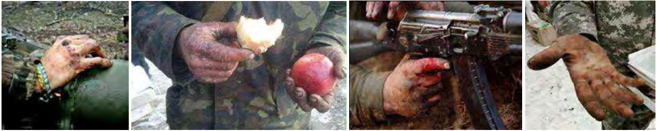
Рис. 1. Метафора випробування і жертвності

Найбільш поширеними в соціальних мережах візуальними образами, які стають основою для створення концептуальної метафори, є зображення руки. В інтернет-мемах зображення руки виступає як певний багатозначний і багатовимірний символ, що володіє «майже бездонною смисловою глибиною, яку практично неможливо вичерпати будь-якої однієї жорстко фіксованою інтерпретацією; значною мірою вона залежить від мінливого культурного контексту» [11, с. 171].