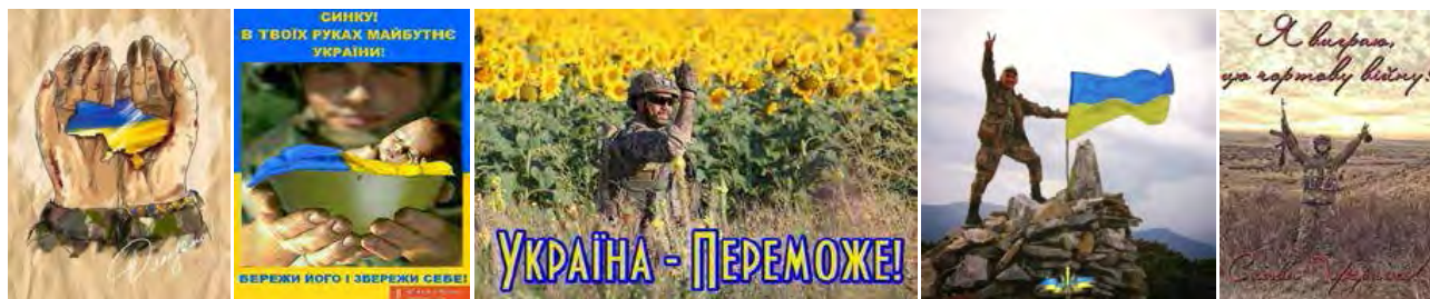
Рис. 3. Метафори віри в майбутній мир

Бо на війні, як на долоні, видно все. Як ти вчиниш – врятуєш друга, ризикуючи життям, або сховаєшся, щоб залишитися живим? І кожен робить свій вибір» ( http://1tv.com.ua/news/channel/66125 ). Осмисливши когнітивну структуру візуальної метафори, ми можемо вербалізувати зоровий образ: ВІЙНА – ЦЕ ТРАНСФОРМАЦІЯ .