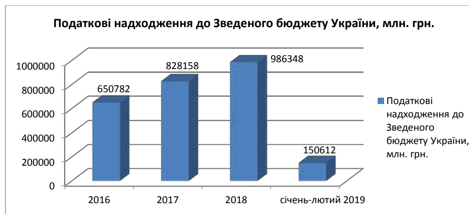
Рис. 1.1. Динаміка податкових надходжень до зведеного бюджету України 2016-2018 рр. та січень-лютий 2019р., млн. грн.

Джерело: сформовано автором на основі даних [2-5]