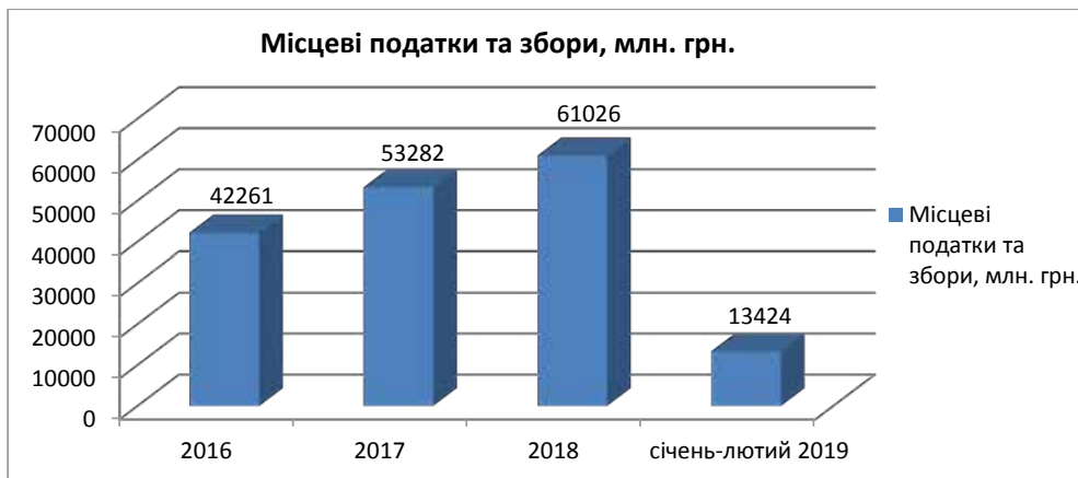
Рис. 1.3. Динаміка надходжень місцевих податків до зведеного бюджету України 2016-2018 рр. та січень-лютий 2019 р., млн. грн.

Джерело: сформовано автором на основі даних [2-5]