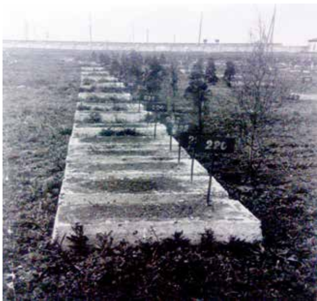
Рис. 3. Кладовище військовополонених в м. Одеса (1959 р.)

Процес ліквідації кладовищ продовжувався і частина з них існувала лише на папері. А наявні заважали, адже розташовувались часто в межах міста. Один з подібних актів огляду кладовищ, датованих квітнем 1958 р. стосувався й південноукраїнського міста Берислав, що на Херсонщині: «На кладовищі поховано 130 осіб німецьких військовополонених, кладовище розміром 50 на 75 метрів обнесене неглибоким ровом, розпізнавальні знаки на могилах відсутні. Надгробки внаслідок атмосферних опадів зруйновані. Кладовище розташоване у смузі території цегельно-