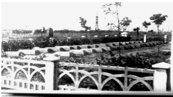
Рис. 4. Кладовище спецшпиталю № 4564 на міському цвинтарі м. Миколаєва (1959 р.)

Україна підтримує міждержавну співпрацю з обміну інформацією про місця поховань військовополонених. Із 1993 р. на підставі дозволів місцевих органів влади розпочинає в Україні свою діяльність міжнародна гуманітарна організація – Народний Союз Німеччини з догляду за військовими могилами [26, с. 286]. Цю громадську організацію засновано в 1919 р. і з цього часу вона взяла на себе функцію догляду за військовими похованнями Першої світової війни.