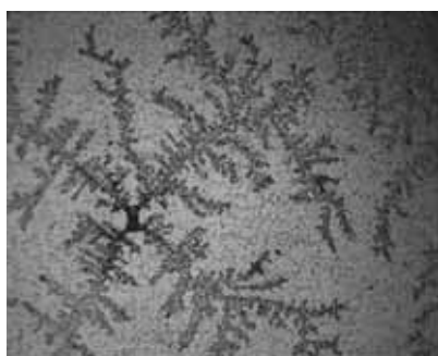
Рис. 1. Микрокристаллизация ротовой жидкости пациента с паренхиматозным паротитом без абсцедирования.

Примечание: значения, помеченные звездочкой (*) означают, что p > 0,05 ; значения без звездочек означают, что p < 0,01 .