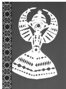
«Ой весна, весняночка»