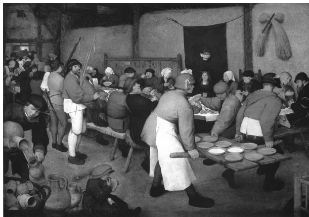
Пітер Брейгел Старший. Селянське весілля. Дата завершення 1568 р.

8) Північне Відродження тривало: а) з XIII по XV ст.; б) з XIV по XV ст.; в) з XV по XVI ст.