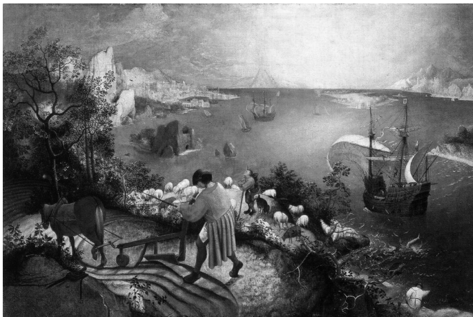
Пітер Брейгель Старший. Падіння Ікара. 1558 р.

Перед аналізом картини «Вавилонська вежа» вчитель пояснює, що даний артефакт існує у двох варіантах: «Велика Вавилонська вежа», що зберігається у Відні, і «Мала Вавилонська вежа» (Роттердам). Пітер Брейгель, як істинний митець, прагне виховувати та вдосконалювати людське суспільство. Навіть біблійні сюжети він екстраполює в довоколишній світ, пише таким, щоб складний Всесвіт став зрозумілим кожному. Так, навіть події біблійної оповіді про будівництво Вавилонської вежі художник переносить до Антверпену (столиці Нідерландів). Сюжет картини узятий із 11-ї глави «Книги Буття», де описується будівництво башти заввишки до небес у рівнині Сеннар. Населення Землі, що мало в ті дні «одну мову й один прислівник», вирішує «зробити собі ім'я, перш ніж розсіятися по лицю Землі». Господь змішав мови людей, і вони перестали розуміти один одного, будівництво припинилося, честолюбний задум залишився нездійсненим. Ім'я міста й вежі було Вавилон. Це слово з Біблії утворене від старогрецького дієслова bab-ilu , що означає «плутати, змішувати» (у аккадській мові слово bab-el означає «брами Бога»). Історія будівництва вавилонської вежі стала символом марних, пихатих прагнень, яким Провидіння кладе кінець.