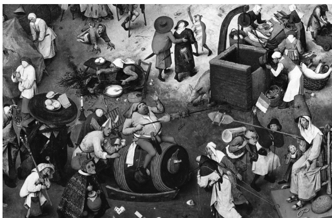
Пітер Брейгел Старший. Фрагмент картини «Битва Посту і Масляної». 1559 р.