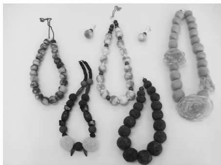
Рис. 4. Прикраси з вовни (техніка мокрого валяння вовни)

На заняттях з валяння вовни діти навчалися виготовляти кульки технікою «мокрого валяння». Було поставлено завдання: виготовити із кульок прикрасу на подарунок мамі. Вихованці, нанизуючи на довгу нитку великі за діаметром кульки, виготовляли намисто; з менших кульок – браслети; фіксуючи на стрічку, робили віночок; прикрашали гудзики; фіксували на шпильки, імітуючи брошки (рис. 4).