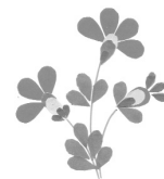
Рис. 3. Поєднання декількох елементів у композицію

На основі вивченого матеріалу окремі елементи поєднувалися в невеликі композиції (рис. 3). Таким чином творчий пошук спонукав дітей відмовитись від відомих побудов елементів, підвищуючи цим емоційну напругу.