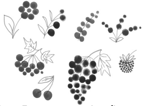
Рис. 1. Елементи у вигляді комбінування різноманітних поєднань круглих плям

Наступного разу вихованці мали знайти спосіб, щоб утворити такі ж кольорові плями, не забруднюючи рук (матеріали надавалися). Для цього діти застосовували дитячі гумові соски, медичні піпетки, незагострений бік олівців, обмотували м'яким ганчір'ям палички.