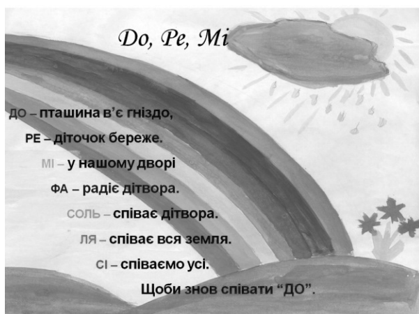
Рис. 3. Слайди з текстами пісень (програма Microsoft Office Power Point)

Отже, спів у режимі караоке – поширена форма виконання пісенного репертуару на уроках музичного