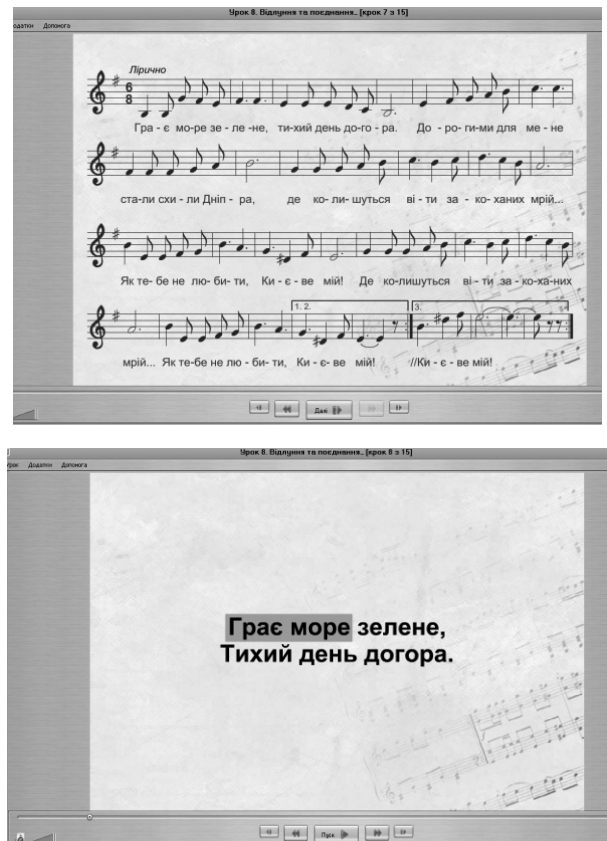
Рис. 2. Робочі вікна ППЗ «Музичне мистецтво. 8 клас»

лодії вгору, униз, на місці, стрибками), сприяє візуалізації ритмічного рисунка музичного твору, містить вказівки щодо зміни артикуляції чи динамічних відтінків (рис. 2) [3, с.7]. На нашу думку, поєднання в одному мультимедійному продукті зазначених функцій (демонстрація пісні, наявність нотного тексту, можливість виконання в режимі караоке), відповідність пісенного репертуару вимогам навчальної програми, а також доступний україномовний інтерфейс робить даний ППЗ зручним у користуванні та значно полегшує підготовку до уроку.