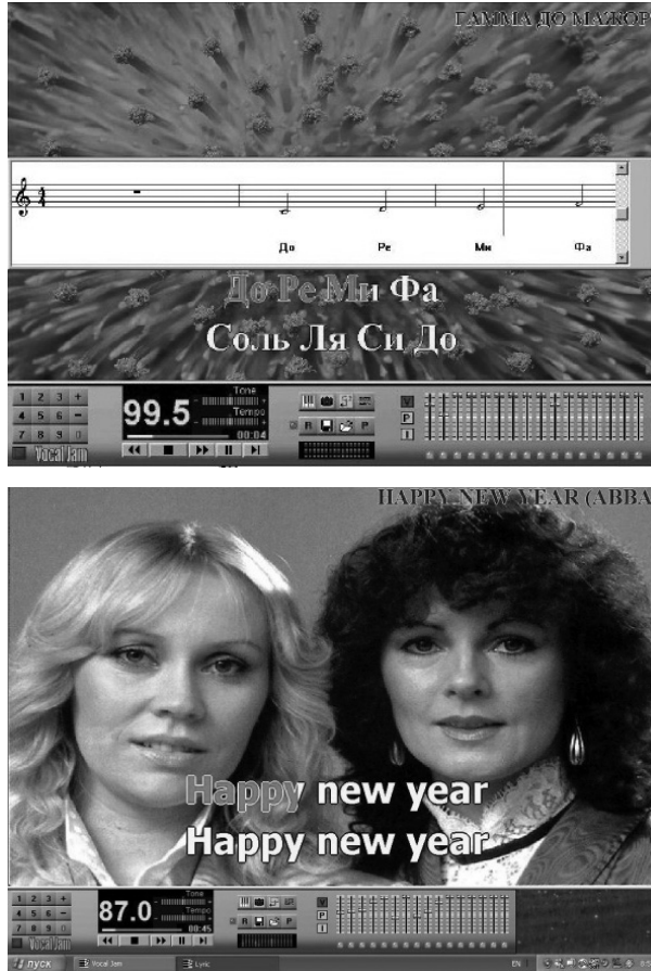
Рис. 1. Робочі вікна програми Vocal jam

російського сольфеджіо, навчання читання нот. Такі караоке-програвачі, як GalaKar, Vanbasco's karaoke, можуть транспонувати мелодії пісень та змінювати темп, а за допомогою програми KarMaker можна самому записати необхідний музичний супровід до пісні [1, с. 28–29].