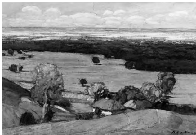
Василь Кричевський. Перевіз. 1937 р. Полотно, олія. 54,5 x 78