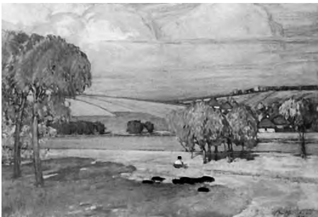
Василь Кричевський. Пейзаж. 1921. Дикт, олія. 63,3 x 86

Таким чином, вплив технік живопису на загальний колорит навчального пейзажу має стати практичною скла-