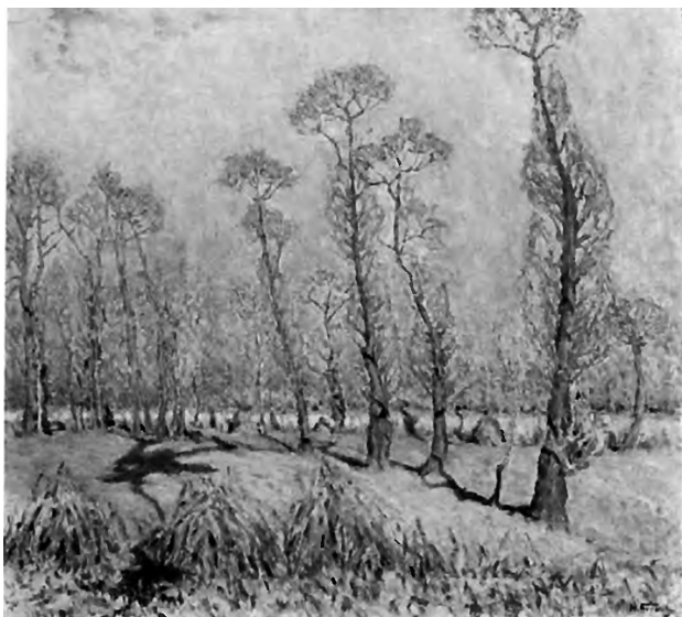
Микола Бурачек. Золота осінь. 1916 р. Полотно, олія. 89,5 x 94,5

довою методикою викладання даного жанру мистецтва в початковій школі Для формування творчої особистості дитини має значення засвоєння нею основних понять: композиція, лінія горизонту, акварельна техніка, світло, колір, колорит та їх практичне використання.