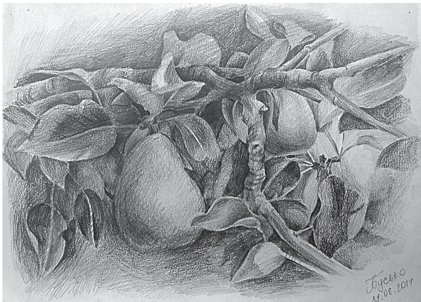
Мал. 1. Завдання з плернеру.

Навчання образотворчої грамоти базується на візуальному пізнанні навколишньої дійсності. Найповніше це відбувається в процесі роботи на