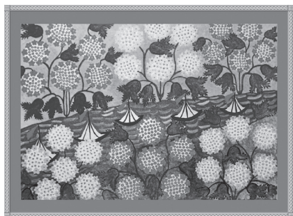
Мал. 1. Картина М. Приймаченко

Б) Активна комунікація в ході організованої педагогом дискусії за змістом картини (дивимося – бачимо – розмірковуємо) (технологія «Формування образного мислення» – ґрунтовно описана в [6]). Серія спеціальних запитань пошукового характеру: «Що відбувається на картині? Що ще відбувається? Що ти ба-