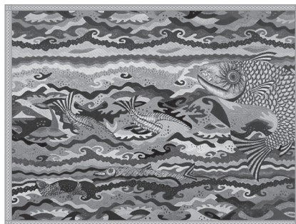
Мал. 5. Картина А. Перейми

4. Рагозіна В. В., Очеретяна Н. В. Творимо природу разом. Заняття з малюками від 3-х до 5-ти років. – Київ : Зірка, 2013. – 21 с.