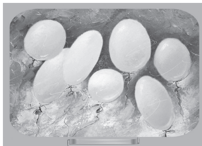
Мал. 4. Основа для художньої роботи дитини

Таким чином, у ознайомленні дошкільників із світовим і українським мистецтвом у середовищі ДНЗ і установ культури поширюються форми й методи, що сприяють пізнанню мистецьких творів як естетичних об'єктів у практичній діяльності дитини, в якій вона розвивається як особистість. Цьому сприяє і розроблений курс занять «Картини творимо самі», в якому діти пізнають різні види й жанри образотворчого мистецтва на прикладах творів українських митців, вчать відчувати, переживати, розуміти художні образи і створюють власні роботи за мотивами цих творів. В умовах ДНЗ і родинного виховання курс реалізується шляхом упровадження авторської методики художньо-творчої діяльності старших дошкільників, в основі якої – наслідування дітьми манери митця у своїх роботах, вияв ними максимальної активності та їх творче самовиражен-